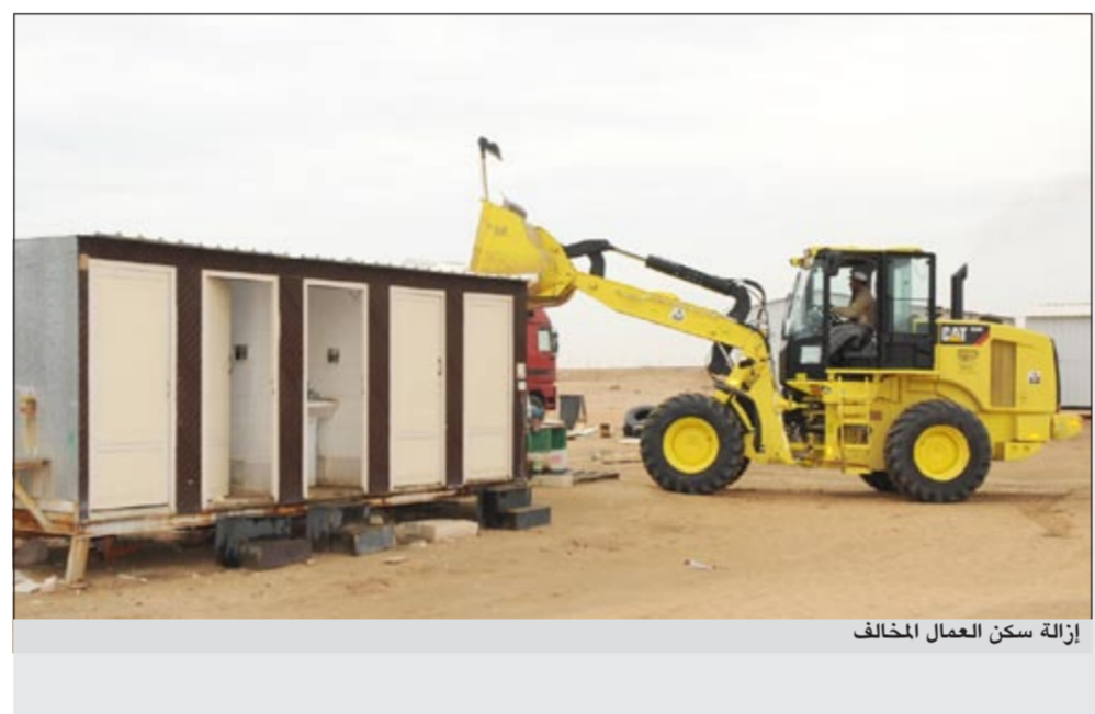
إزالة سكن العمال المخالف