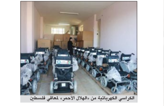
الكراسي الكهربائية من «الهلل الأحمر» لمعاق فلسطين