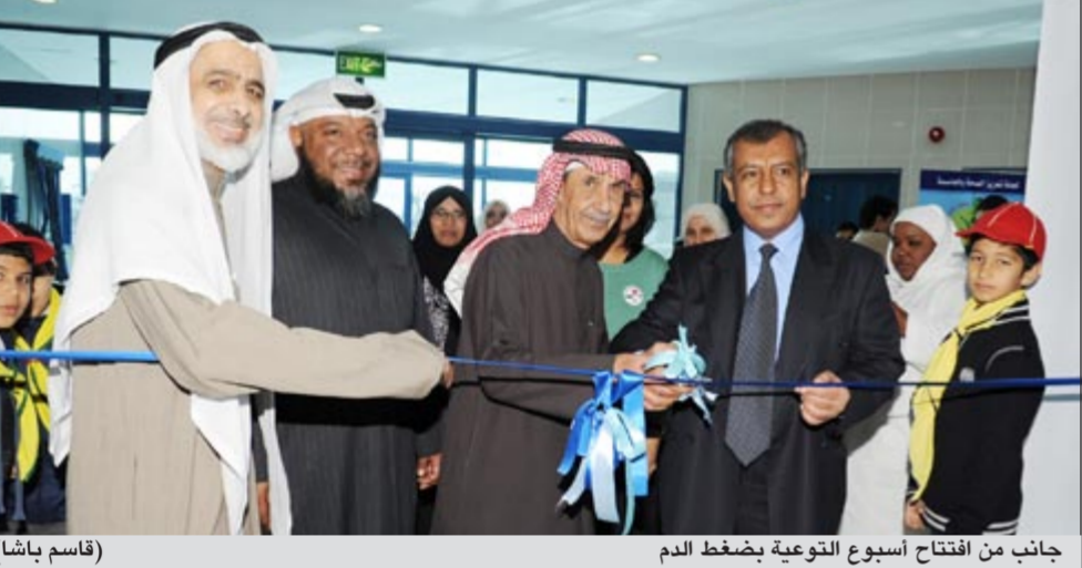
جانب من افتتاح أسبوع التوعية بضغط الدم (قاسم باشا)

أعلن مدير منطقة العاصمة الصحية د.طارق الجسار عن مشروع جديد لإنشاء عيادة متخصصة لاكتشاف مرض ضغط الدم، في مركز عبدالرحمن عبدالمنعني في منطقة الفيحاء، كاشفاً عن إصابة أكثر من 25% من سكان الكويت من مواطنين ومقيمين بالمرض. وقال الجسار في تصريح له بمناسبة الاحتفال بأسبوع التوعية بضغط الدم في منطقة العاصمة بمشاركة وتنظيم عدة جهات من بينها إدارة الصحة الوقائية وتعزيز الصحة وهيئة التمريض والرعاية الصحية الأولية وإدارة التغذية وجمعية القلب الكويتية وعدد من الشركات المعنية، أن الاحتفال بأسبوع ضغط الدم يبدأ من مركز عبدالرحمن عبدالمنعني ويمتد إلى جمعية الفيحاء التعاونية ومستشفى الأميري وعدد من المدارس بالمنطقة، كما كشف الجسار أيضاً عن التنسيق مع وحدة السكري في مستشفى الأميري لتقديم الاستشارات الطبية لمرضى السكر داخل عيادات