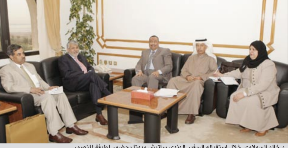
د.خالد السهلاوي خلال استقباله السفير الهندي ساتيش ميها بحضور لطيفة المنصور

استقبل وكيل وزارة الصحة د.خالد السهلاوي بمكتبه صباح أمس سفير الهند بالكويت ساتيش ميها والوفد المرافق له وبحضور مديرة إدارة التمريض لطيفة المنصور. واستعرض خلال اللقاء جوانب التعاون الصحي بين الكويت والهند والأفاق والرؤى المستقبلية لتطوير هذا التعاون على الصعيد الصحي وبما يحقق الصالح العام وتعزيز أواصر الصداقة بين البلدين وتبادل الخبرات والقضايا ذات الاهتمام المشترك في مجال الخدمات الصحية وسبل تعزيزها بين البلدين.