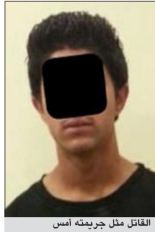
القاتل مثل جريمته أمس

وكشف المصدر الأمني عن ان كاميرات المجمع بشكل عام وكاميرات السوق التجاري الذي اشترى منه المتهم اداة الجريمة استطاع من خلالها رجال الإدارة