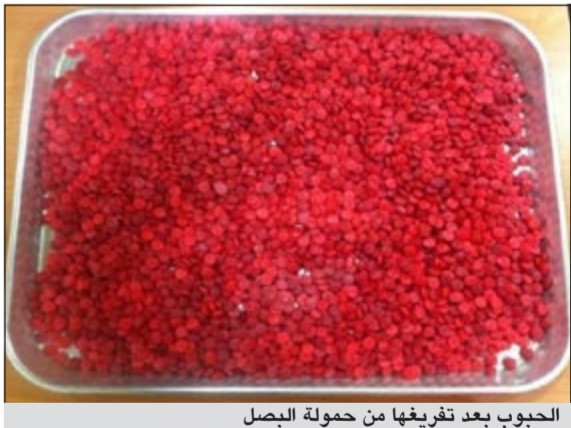
الحبوب بعد تفريغها من حمولة البصل

احبط رجال منفذ السالمي يوم امس محاولة ضخ 5500 حبة ترامادول حاول وادف مصري يعمل سائق شاحنة تهريبها في شاحنة حملتها بصل قادمة من الاردن. وقال مصدر جمركي ان رجال منفذ السالمي شكوا في وادف مصري ظهرت عليه علامات الارتباك، ليتم اخضاع الشاحنة للتفتيش وعثر بداخلها على الحبوب وعليه تمت احالة الوادف والمضبوطات الى الادارة العامة لمكافحة المخدرات.