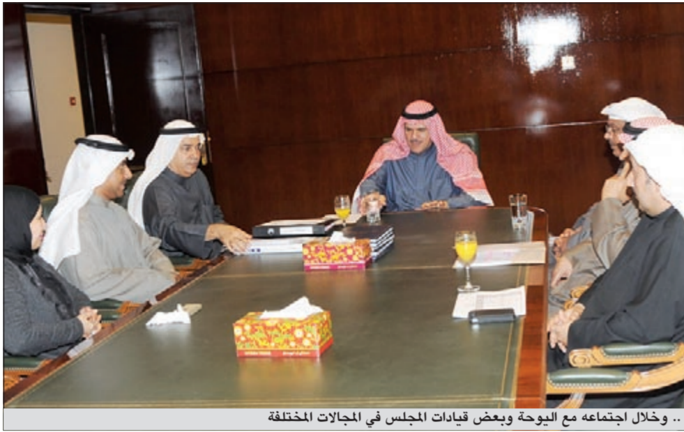
.. وخلال اجتماعه مع اليوحة وبعض قيادات المجلس في المجالات المختلفة

وتمن الوزير جهود المجلس في الاهتمام بأنشطة الطفل، مؤكداً على ضرورة التنسيق المستمر مع وزارة التربية في تلك الأنشطة.