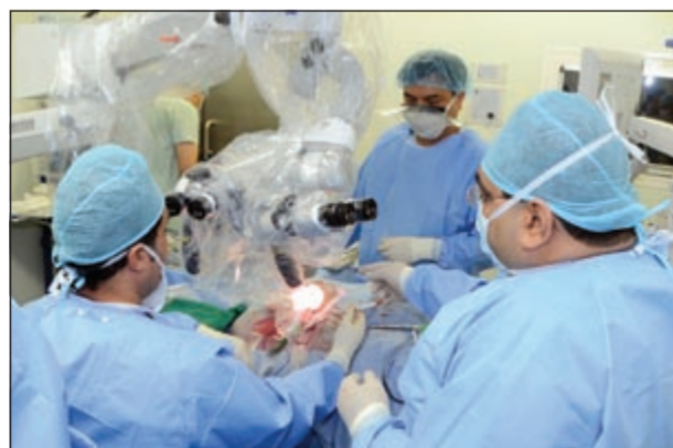
جانب من عملية زرع القوقعة في مستشفى زين

التي ان هناك فارقا بين جهاز القوقعة والسماهة العادية، حيث ان السماعه الديجيتال تضخم الصوت من خلال الميكروفون الموجود بها فيصبح الصوت واضحا لدى المريض، اما زراعة القوقعة فلا تضخم الصوت لكنها تحول الموجات الصوتية الى نبضات كهربائية داخل القوقعة فيسمع المريض الصوت. وقال ان جهاز القوقعة تبلغ قيمته من 12 الى 14 ألف دينار تتحملها وزارة الصحة، والسذي على الرغم من ارتفاع تكلفته إلا انه يوفر على الدولة الكثير من تكلفة التعامل مع المريض فاقد السمع الذي سيحتاج لمدارس خاصة ومعاملة خاصة وما الى ذلك، موضحا ان العملية تجري لمن لديهم فقدان في السمع منذ الولادة او من كانوا يسمعون ولكن وصلوا الى مرحلة فقدان السمع، وهذا النوع من الممكن ان يتم إجراؤه في أي سن حتى اذا وصل المريض لـ 90 عاما، ويجب تأكد الأهل من عدم تأخر الطفل في النطق او السمع، مبينا انه في حال اكتشاف تأخر السمع او الخلق فلا بد من مراجعة مركز سالم العلي للنطق والسمع حتى يتم فحصه من خلال الفريق الطبي المتخصص، لافتا الى اهمية اجراء عملية زراعة القوقعة للأطفال قبل بلوغ سن الست سنوات حتى يمكن تحقيق نتائج ايجابية من خلالها، مؤكدا ان نسبة نجاح هذه العمليات كبير جدا، الاجز بسيط جدا ونادر وهو ما يتعلق بالجهاز نتيجة وضعه داخل الجسم. من جانبه، قال د.علي صفر ان هذه العمليات مضي عليها فترة