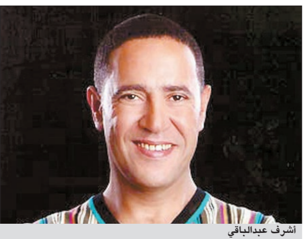
أشرف عبد الباقي

والألمنيوم واعتزل الفن قد اقرب، حيث قال مازحاً: «قريباً سأعزل التمثيل وسأعود إلى مهنة الألمنيوم».