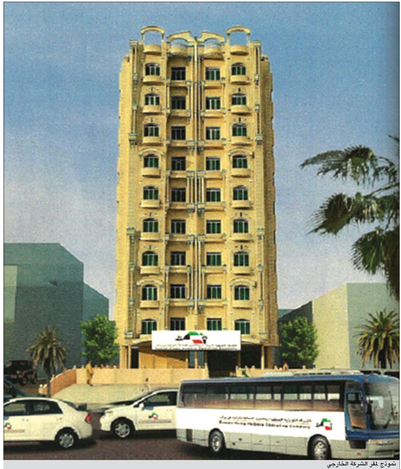
نموذج لمقر الشركة الخارجي