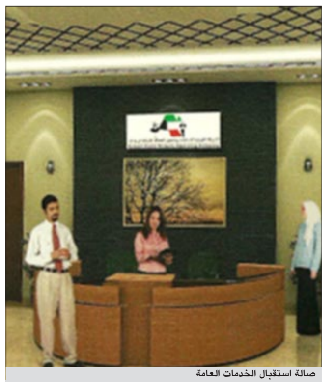
صالة استقبال الخدمات العامة