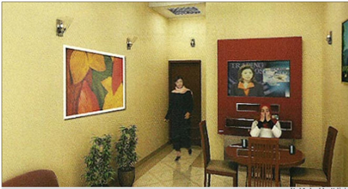
غرفة المعيشة بمقر الشركة