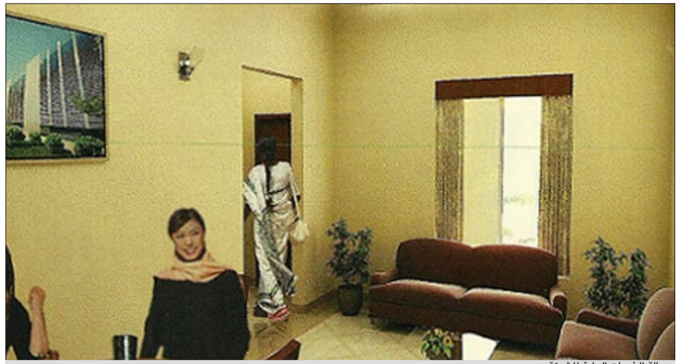
صالة الخدمات العامة للشركة