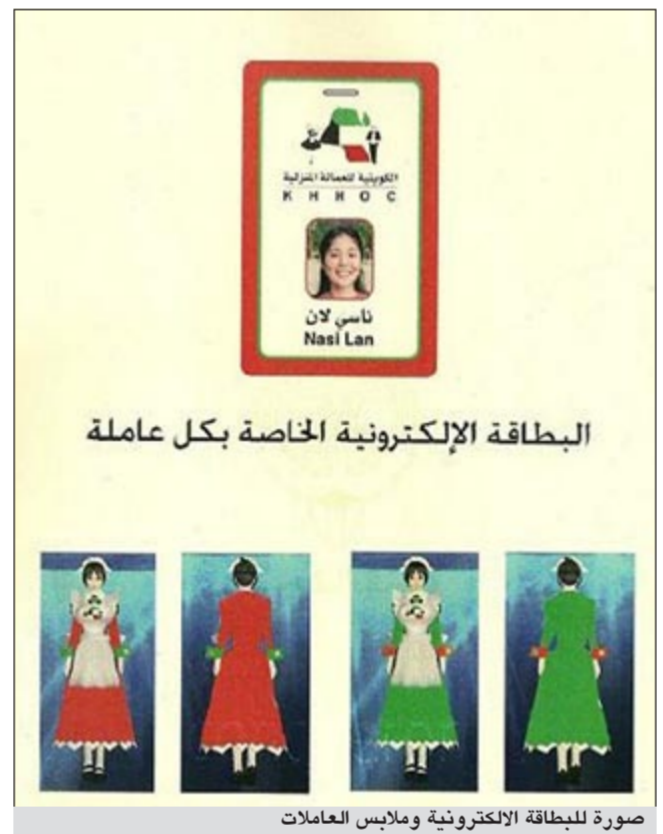
صورة للبطاقة الإلكترونية وملابس العاملات

شدد أمين سر مجلس الأمة النائب كامل العوضي على أهمية العمالة المنزلية، مؤكداً أن قضية العمالة المنزلية أصبحت هاجساً يشغل بال كل أسرة كويتية. وقال العوضي: لقد أصبحت الأسر الكويتية تعاني من مشاكل العمالة المنزلية وتتكدس المبالغ الطائلة من أجل استقدامها وتشغيلها، مشيراً إلى أن أموال المواطنين هذه تذهب هدراً في ظل استهتار هذه الفئة وبمساعدة وتلاعب بعض أصحاب مكاتب الاستقدام الذين أصبح مهمهم المتاجرة بالعمالة المنزلية مستغلين في ذلك ضعف القوانين والقرارات الرادعة وعدم وجود آلية موحدة ومنظمة لاستقدام العمالة وتشغيلها. وأشار العوضي إلى أن العمالة المنزلية التي يتم جلبها هي عمالة غير مربية وغير مهياة عملياً ونفسياً للعمل في بيئة وعادات المجتمع الكويتي، مما جعلها تشكل عبئاً كبيراً على الأسر الكويتية ومرتعاً خصباً للتكسب المادي من قبل أصحاب النفوس الضعيفة من بعض أصحاب المكاتب كما أصبحت هذه الفئة نقطة سوداء في سجل الكويت في المحافل الدولية ومنظمات حقوق الإنسان. وأوضح العوضي إن مشروع إنشاء شركة لاستقدام العمالة المنزلية والذي رفعت وزارة الداخلية لمجلس الوزراء ووافق