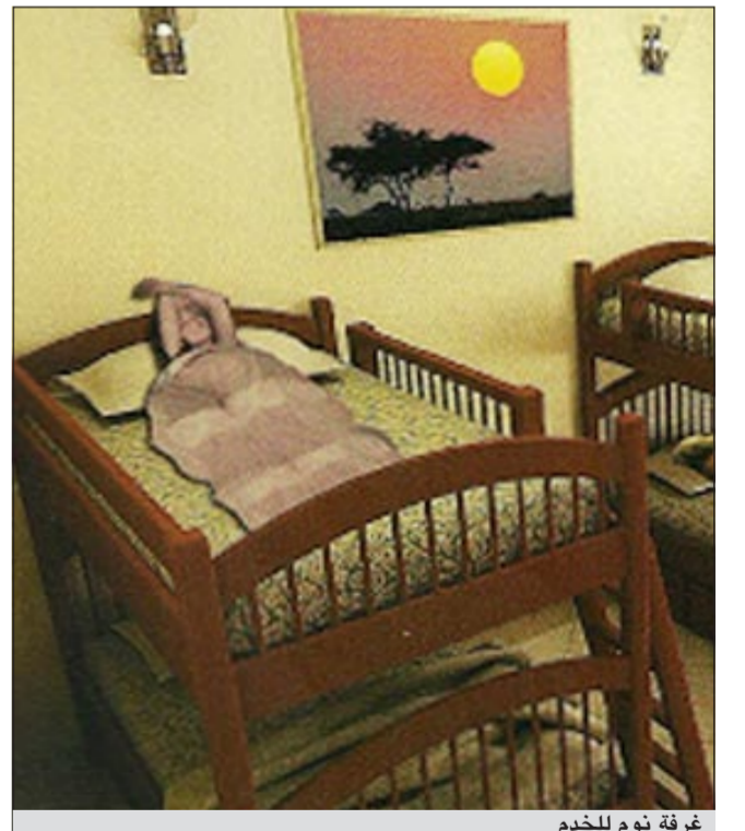
غرفة نوم للعميل