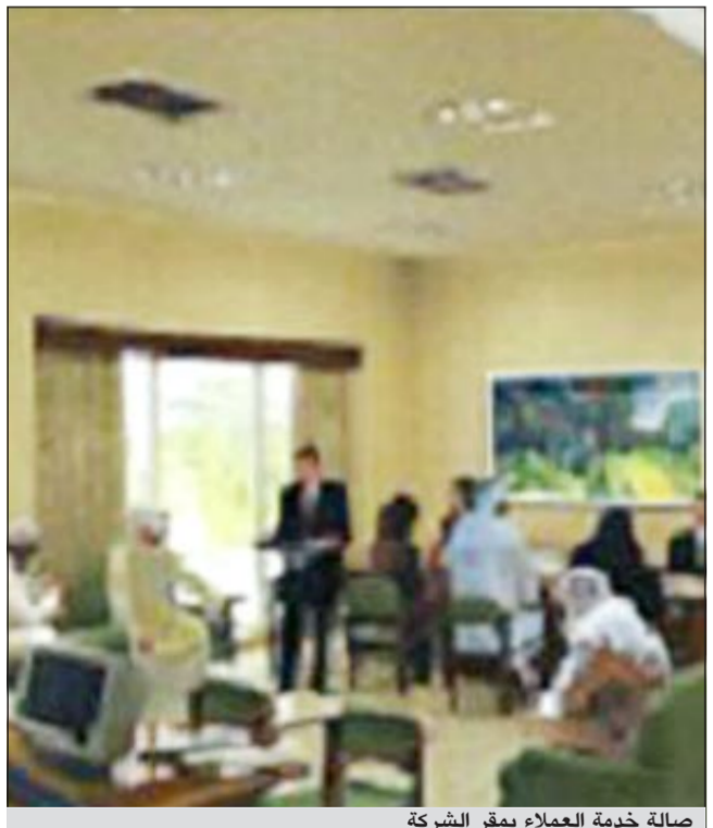
صالة خدمة العملاء بمقر الشركة