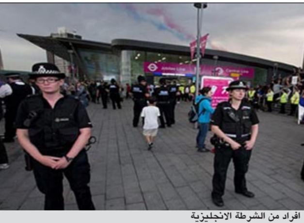
الفراد من الشرطة الانجليزية

سرية مسربة لشرطة لندن اطلعت عليها تكشف للمرة الأولى تفاصيل خطط تخفيض عدد مخافر العاصمة البريطانية من 133 إلى 71 مخفرا وعدد المخافر التي تعمل 24 ساعة في اليوم من 64 إلى 33 مخفرا وعدد المخافر العاملة بدوام نصفى من 52 إلى 33 مخفرا ومخافر المتطوعين من 17 إلى 5 مخافر فقط. وأشارت إلى أن إحياء لندن الضخمة التي ترتفع فيها معدلات الجريمة مثل لامبت وهاريغني وميدلغوي وإيلينغ ستتمك مخفرا واحدا فقط يعمل 24 ساعة في اليوم بموجب الخطط الجديدة.