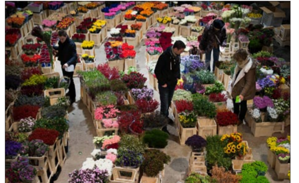
ورود استعدادا للكريسماس

بريطاني للاجازات ليكون اليوم الذي يشهد أعلى معدلات المغادرة إلى الخارج حيث سيشهد مطار هيثرو عودة المتطوعين للعمل على مساعدة المغادرين وذلك للمرة الأولى منذ دورة الألعاب الأولمبية لندن 2012.