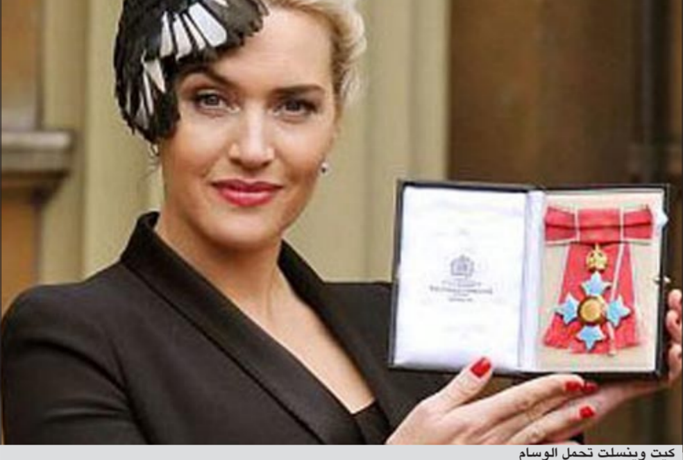
كيت وينسلت تحمل الوسام