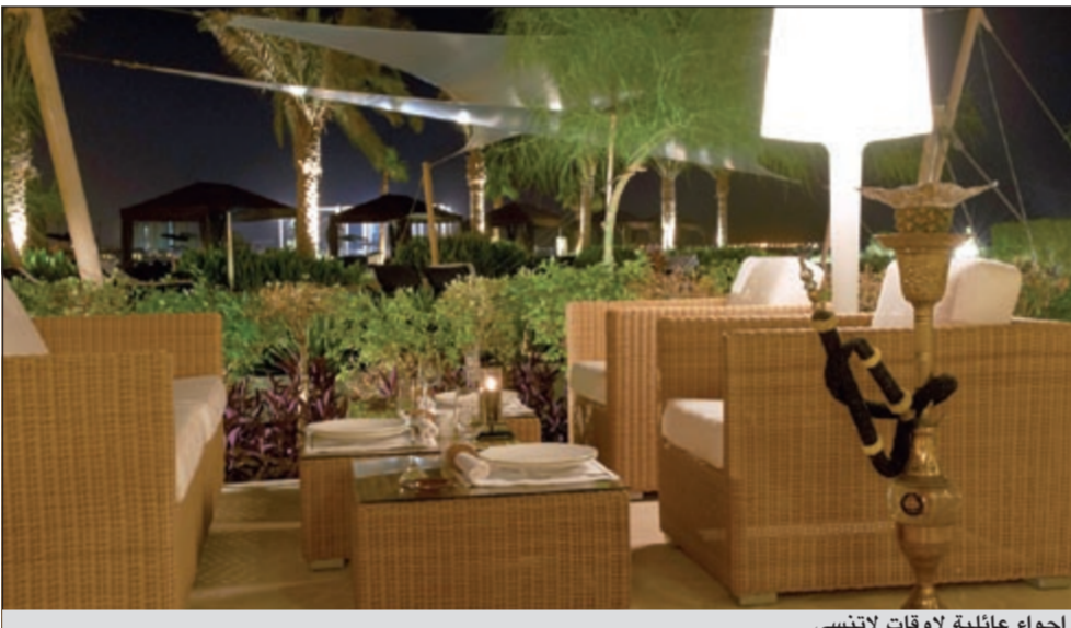
اجواء عائلية لاقوات لاتنسى

هكذا، ويلتزم فندق سانت ريجيس الدوحة بتقديم تجربة فريدة لتناول الطعام في قطر من خلال مطاعم حديثة وأنيقة وفاخرة.