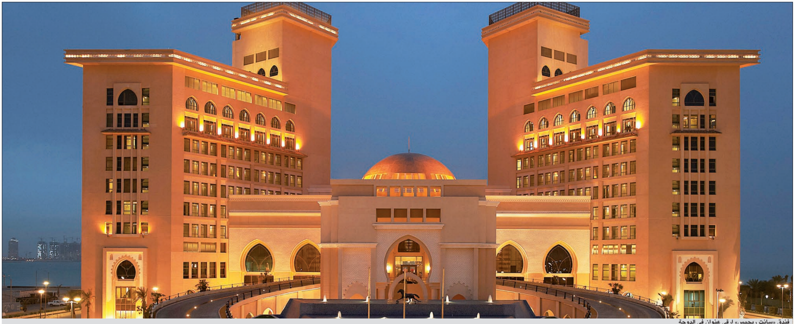
فندق «سانت ريجيس» ارقى عنوان في الدوحة