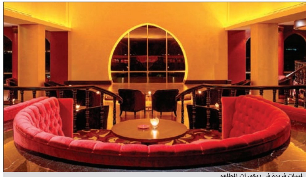
لمسات فريدة في ديكورات المطاعم

وسانت ريجيس الدوحة تلقي فيه الرفاهية التقليدية بالمعاصرة، لتقديم أفضل خدمات الضيافة العالمية بارقي المعايير، أسسه جون جاكوب أستور الرابع منذ قرن بعد إنشاء سانت ريجيس في نيويورك، تشتهر مجموعة الفنادق هذه بالفخامة والخدمات المترفة ما يجعلها من أفضل فنادق قطر. وتواصل فنادق سانت ريجيس