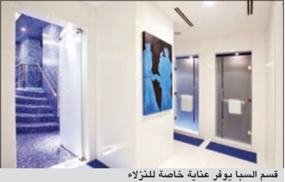
قسم السبا يوفر عناية خاصة للنزلاء

يفضل إطلاله على الخليج العربي بشواطئه الرملية الأخاذة، فإن فندق «سانت ريجيس الدوحة» يقع ضمن بيئة منتجة طبيعية، متجا لضيوفه تجربة استرخائية أو استجمامية تعيد لهم حيويته ونشاطهم. ولهذا السبب له رؤيته الخاصة التي تركز على قناعة راسخة بأن لكل جسم طبيعته الخاصة، وبأن لكل بشرة فرادتها. ويضمن فريق المعالين الطبيين المتخصصين بأن تتوافق كل جلسة بدقة متناهية مع الطبيعة الخاصة للبشرة والجسم. كما أن جميع مستحضرات العناية المستخدمة في السبا حصرياً ومستلهم من الطبيعة، حيث يوفر السبا لضيوفه أكثر من خمسين مستحضر عناية مختلفا، بما يضمن توافر ما يتوافق مع كل بشرة. ويفرّد السبا على أكثر من صعيد، ويقدم لضيوفه أصناف الشاي المنعشة وشراب الكوكتيل المبرد والشوكولاتة المنكهة عند نهاية كل جلسة، ليضمن لهم السكينة التامة وسط أجواء الأخاذة، ويتألف السبا من 22 غرفة علاجية، مع مرافق منفصلة للذكور والإناث، بما في ذلك غرف البخار والاستجمام وأحواض الجاكوزي.