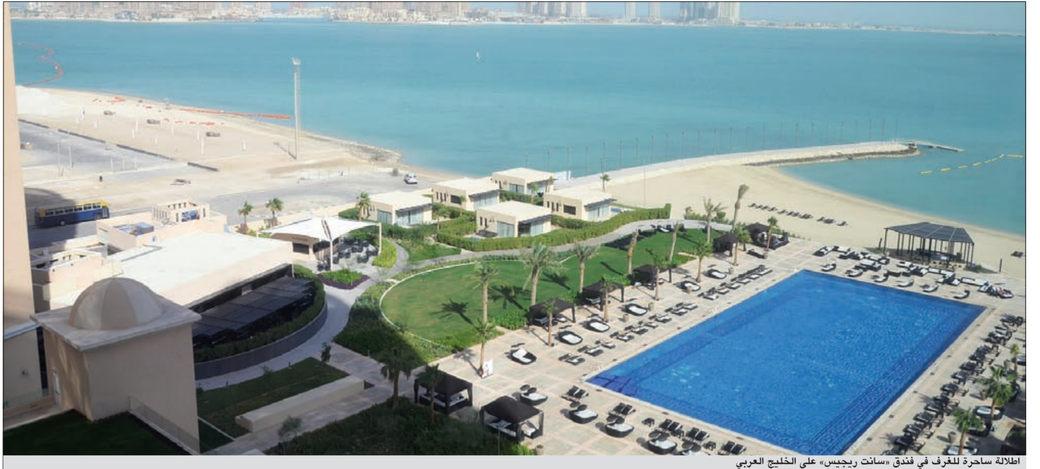
اطلالة ساحرة للغرف في فندق «سانت ريجيس» على الخليج العربي