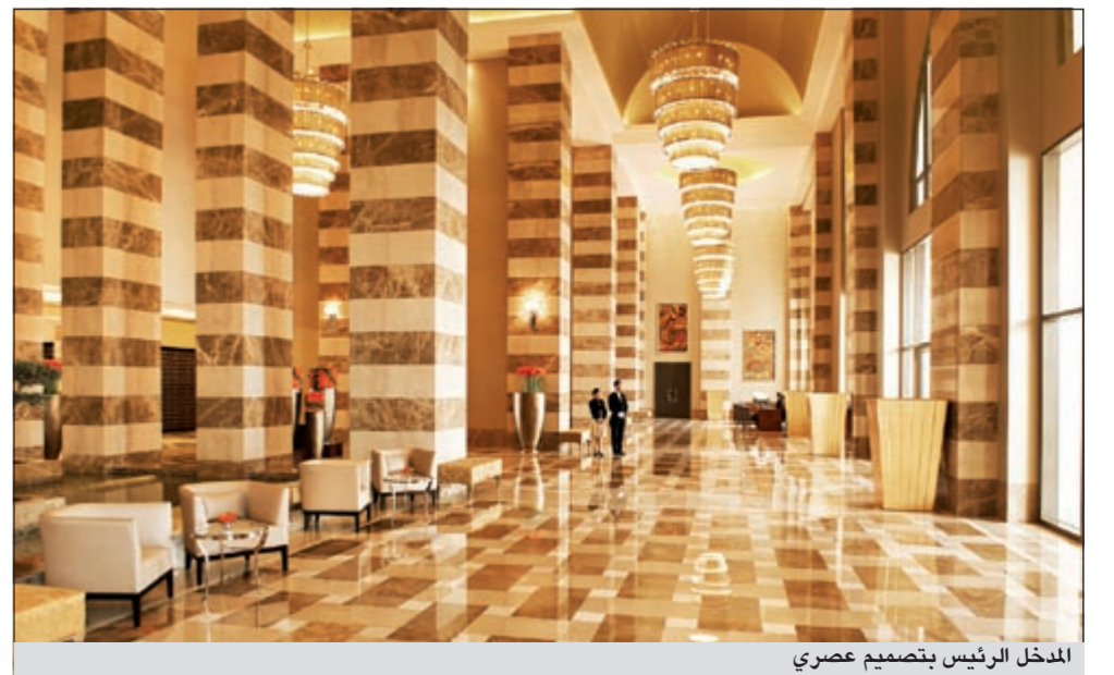
المدخل الرئيس بتصميم عصري