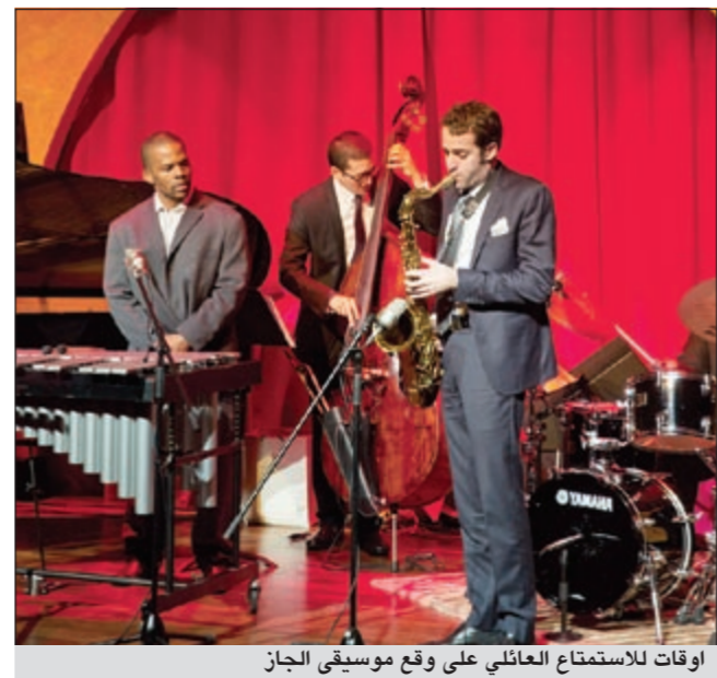
اوقات للاستمتاع العائلي على وقع موسيقى الجاز