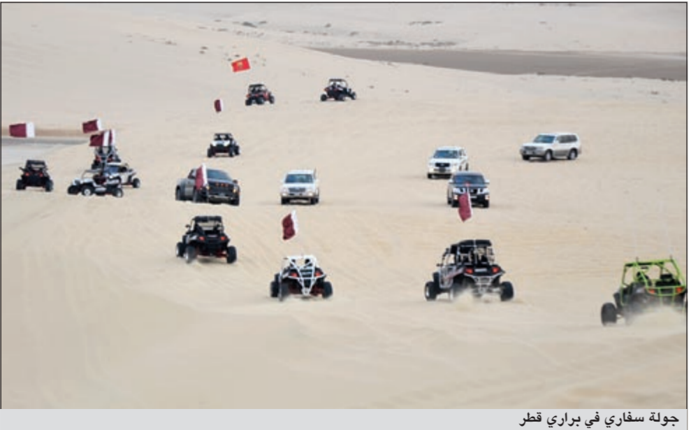
جولة سفاري في براري قطر

ويتضمن «دوحة» وعلى امتداد برجين متلاصقين، يتألف الواحد منهما من 13 طابقا، ما مجموعه 266