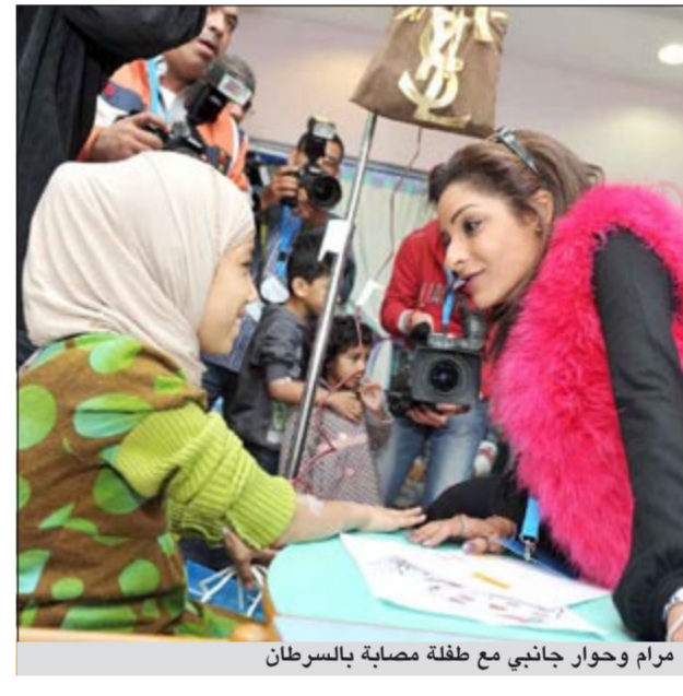
مرام وحوار جانبي مع طفلة مصابة بسرطان

اطفالا مساكين يعانون من هذه الأمراض القاسية التي لا يستطيع الكبار تحملها أتالم كثيرا، وأرى أنهم ليسوا بحاجة الى نظرة شفقة أو عطف، من أحد، بقدر ما هم بحاجة الى الضحكة والدعم الروحاني والمعنوي.