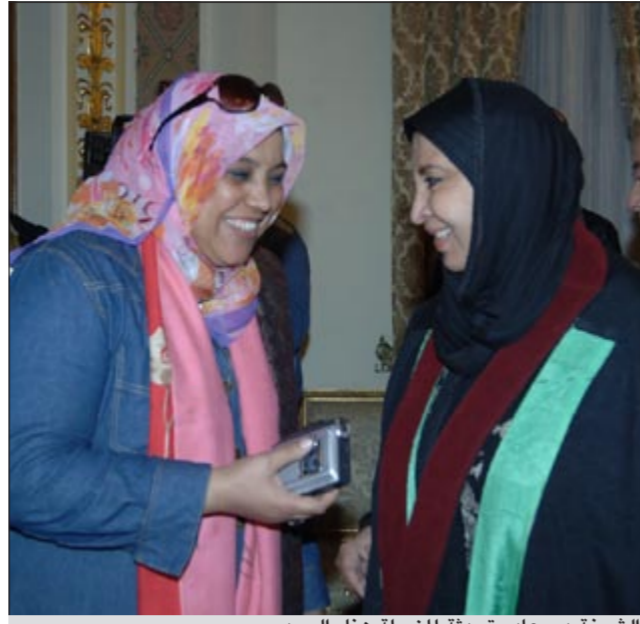
الشيخة د. سعاد الصباح مع عدد من الحضور في الحفل