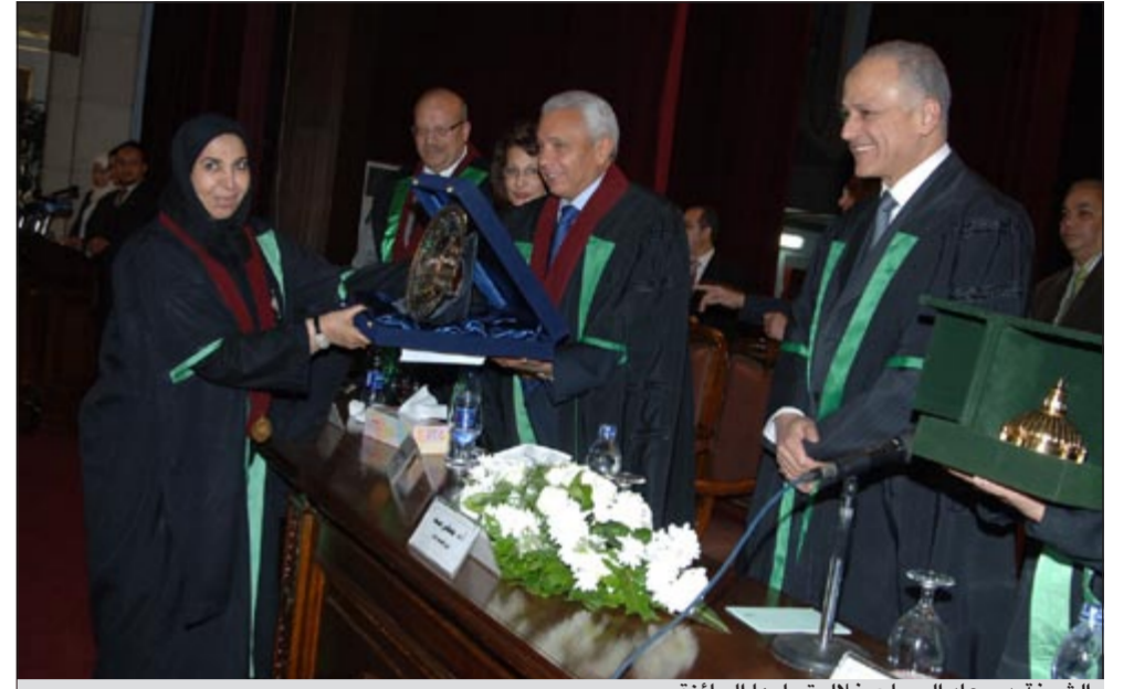
الشيخة د. سعاد الصباح خلال تسلمها للجائزة

تقديرًا لدورها في دعم العلم والعلماء بمناسبة الاحتفال بعيد العلم الحادي عشر بعد المائة