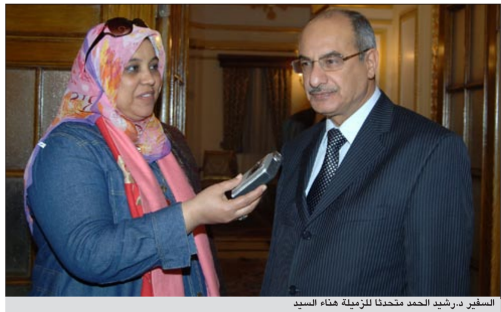
السفير د. رشيد الحمد متحدثاً للزميلة هناء السيد

وأشارت د. الصباح إلى أنها سبق أن تم تكريمها من قبل جامعات ومراكز أبحاث علمية عديدة على المستويين العربي والعالمي إلا أنها قالت إن هذا التكريم يحتل مكانة كبيرة عبر أجيال عديدة جاءت من مختلف الدول العربية ودرست