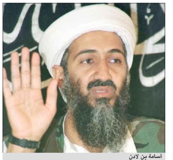
أسامة بن لادن

لوس انجليس - أ.ف.ب: انتقد ثلاثة من أبرز أعضاء مجلس الشيوخ الأمريكي بينهم المرشح السابق للبيت الأبيض جون ماكين مساء الأربعاء الفيلم الأخير للمخرجة كاترين بيجلو حول أسامة بن لادن بسبب تركيزه على أن التعذيب لعب دوراً أساسياً في العثور على زعيم تنظيم القاعدة وقتله في مايو 2011.