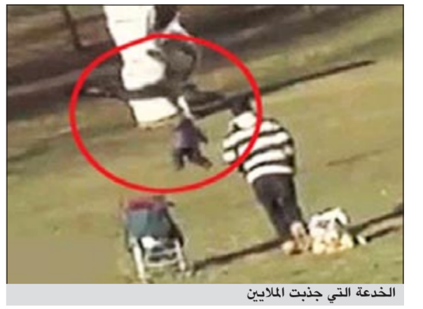
الخدعة التي جذبت الملايين

قالت غوغل إن دافعاها الرئيسي من وراء تلك الصفقة كان الاستحواذ على حزمة براءات اختراع موتورولا إلى جانب قطاع إنتاج الهواتف المحمولة وتصميمها. وبموجب شروط الاتفاق، ستحصل غوغل على 2,05 مليار دولار نقداً و300 مليون دولار على شكل أسهم مصدرة جديدة في «أريس»، بما يمنحها حصة تبلغ نحو 15,7٪ في الشركة.