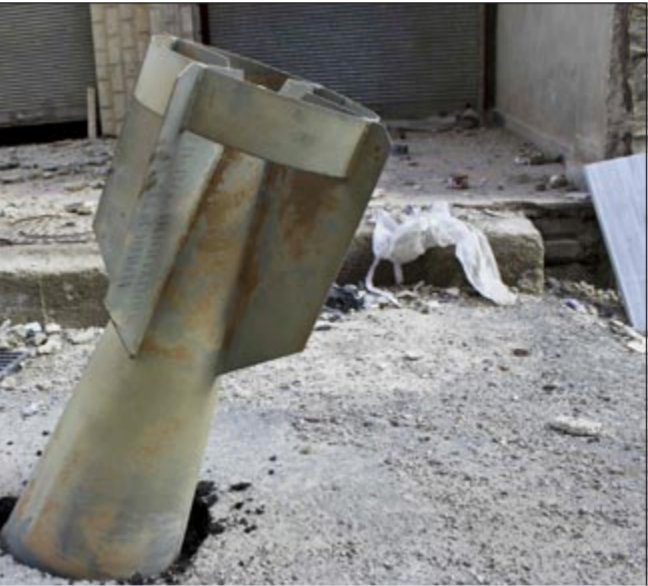
قذيفة اطلقتها القوات النظامية ولم تنفجر في عين ترما في الغوطة

وقال المرصد في بريد الكتروني ان اشتباكات عنيفة دارت «بين القوات النظامية ومقاتلين من عدة كتائب ينفذون هجوما على حواجز للقوات النظامية في بلدة مورك الواقعة على طريق حلب - دمشق الدولي» في الجنوب من مدينة خان شيخون. وأشار إلى وجود «ثمانية حواجز للقوات النظامية ومركزين امثيين وعسكريين» في البلدة التي سبتمكن المقاتلون المعارضون في حال السيطرة عليها «من قطع خطوط الامدادات عن محافظة ادلب في شكل كامل من حماة ودمشق»، وبموازاة ذلك قصفت مدفعية النظام الثقيلة مدن الطامطة وكفرزيتا في شمال حماة من حماة ودمشق»، وعقبة بين الجيش الحر وقوات النظام في بلدة الزغبة. وأعلنت شبكة شام الإخبارية ان الجيش الحر تمكن من تحرير