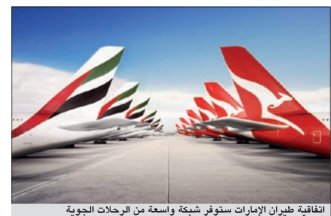
اتفاقية طيران الإمارات ستوفر شبكة واسعة من الرحلات الجوية

بين كوانتاس وطيران الإمارات، خصوصا من حيث توسيع تسهيلات السفر إلى أوروبا بتوقف واحد، وتقليل زمن الرحلات وربط برنامجي مكافأة ولاء المسافرين الدائمين على رحلات الناقلتين. واستطرد جويس قائلا: «سنركز الآن على تقديم إجابات حول القضايا المتبقية التي أثارها اللجنة الأسترالية لحماية المنافسة والمستهلك من أجل المضي قدما في نيل الموافقة النهائية على هذه الشركة المهمة». من جانبه، أشار تيم كلارك رئيس طيران الإمارات، إلى أن ردود الفعل الإيجابية المرحية من العملاء ترافقت مع الحماسة التي يبديها قطاع السياحة الأسترالي. وقال: «شهدت اتفاقية الشراكة بين طيران الإمارات وكوانتاس منذ الإعلان عنها استجابة قوية تعزز ما يتوقع للتحالف بين الناقلتين أن يحققه من فوائد».