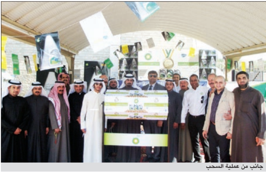
جانب من عملية السحب

صاحب سيارة يقوم بتبديل الزيت باستخدام زيوت فيسكو للمشاركة في العرض، حيث إنه إضافة لاستخدامه أجود أنواع زيوت المحركات التي تحمي السيارات، فإنه أيضا يحصل على فرصة الفوز بالذهب. وتوافر زيوت «بي بي» فيسكو في الكويت بعدة عيوب وأنواع حيث يسري العرض الترويجي الحالي على فيسكو 3000 وفيسكو 5000. يعتبر فيسكو 3000 الحل الأنسب للسيارات التي تعمل بالديزل والبنزين حيث توفر لها نظافة وحماية عالية وطويلة، ليكون بحق درعا حراريا يحمي المحرك، فيكون الاختيار الأفضل للمركبات التي تعمل بالديزل والبنزين، إضافة لأدائه النوعي في التقليل من احتراق الزيت.