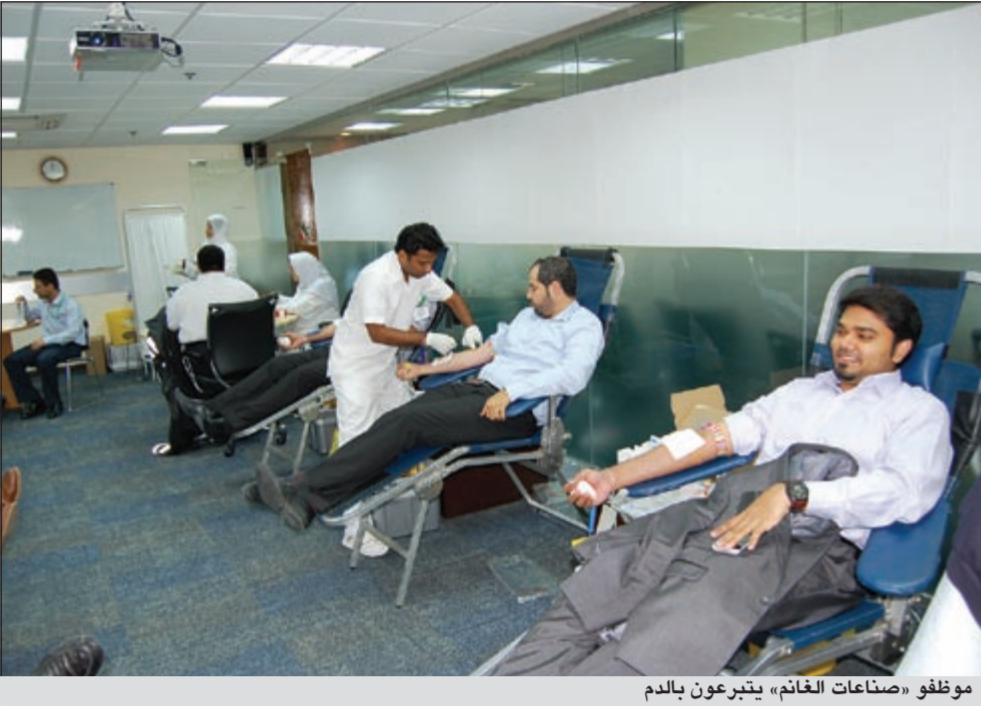
موظفو «صناعات الغانم» يتبرعون بالدم

للموظفين الذين شاركوا في الحملة وإلى الأطباء وموظفي بنك الدم المركزي الذين ساهموا في إنجاح هذا الحدث. تجدر الإشارة إلى أن حملة التبرع بالدم تعد جزءاً من التزام صناعات الغانم بمسؤوليتها ومشاركة المجتمع في التنمية.