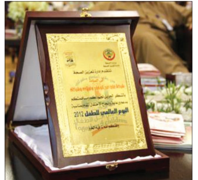
درع اليوم العالمي للطفل

من عشرين شركة عالمية ومحلية دعماً للأنشطة التي أقيمت وشارك فيها أكثر من 250 طفلاً من مختلف مدارس الكويت، حيث تخلل هذه الأنشطة عروض ترفيهية ومسرحية وبرامج توعوية لحقوق الطفل، وبهذه المناسبة أقيمت احتفالية لاختتام هذه الأنشطة تزامنت مع اليوم العالمي للطفل بحضور وكيل وزارة الصحة د.وليد الفلاح وشخصيات تربوية وعامة من الكويت ودول أخرى.