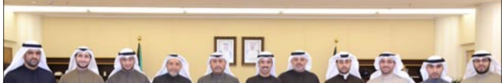
الراشد متوسلاً رئيس واعضاء مجلس ادارة جمعية الثقافة الاجتماعية