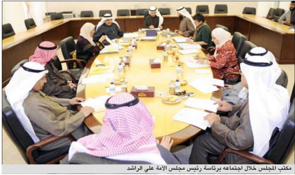
مكتب المجلس خلال اجتماعه برئاسة رئيس مجلس الأمة علي الراشد

أعلن رئيس مجلس الأمة علي الراشد موافقة مكتب المجلس خلال اجتماعه أمس على استمرار تغطية الصحافيين البرلمانيين لجلسات المجلس في المكان المخصص لهم في قاعة عبدالله السالم بلا تغيير، معرباً عن أمله في مساهمة هذا القرار في تعزيز دور الصحافة ووسائل الاعلام، وتسهيل ادائهم لمهامهم في اطار القانون واللوائح المعمول بها في المجلس.