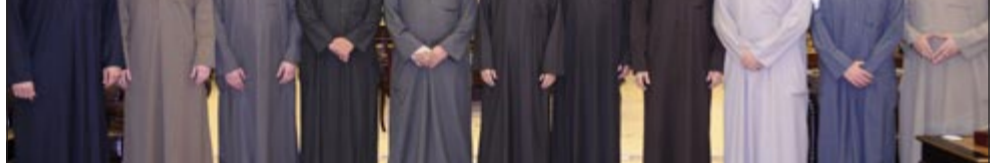
الراشد متوسلاً رئيس واعضاء مجلس ادارة جمعية الثقافة الاجتماعية