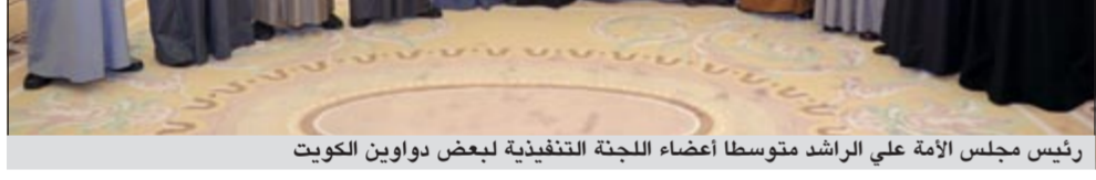
رئيس مجلس الأمة علي الراشد متوسلاً أعضاء اللجنة التنفيذية لبعض دواوين الكويت

كما استقبل الراشد رئيس واعضاء مجلس ادارة جمعية الثقافة الاجتماعية، وجرى خلال المقابلة تقديم التهانى على الثقة التي حظي بها من اخوانه أعضاء مجلس الأمة لرئاسة المجلس، متمنياً له كل التوفيق في منصبه الجديد.