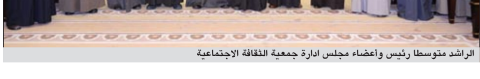
الراشد متوسلاً رئيس واعضاء مجلس ادارة جمعية الثقافة الاجتماعية