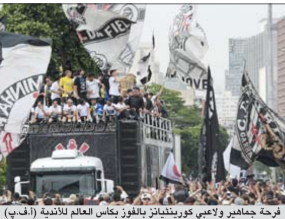
فرحة جماهير ولاعي كورينثيانز بالفوز بكأس العالم للأندية