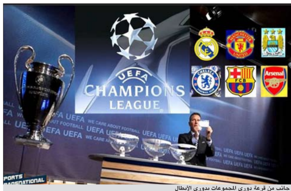
جانب من قرعة دوري المجموعات بدوري الأبطال

تسحب اليوم في مقر الاتحاد الأوروبي لكرة القدم في نيون السويسرية قرعة الدور الثاني من مسابقة دوري أبطال أوروبا بغياب حامل اللقب لكن بوجود 9 أبطال سابقين. وسيغيب عن القرعة تشلسي الإنجليزي (حامل اللقب)، وذلك بعدما فشل في احتلال احد المركزين الأولين في مجموعته لأن يوفنتوس الإيطالي وشاختر دانينيتسك الأوكراني تفوقا عليه. وستواجه في الدور الثاني 9 أبطال سابقين هم ريال مدريد وبرشلونة الإسبانيان وميلان ويوفنتوس الإيطاليان ويوروسسا دورتموند وبايرن ميونيخ الألمانيان وستلتك اسكو تلندي وبورتو البرتغالي ومان يونايتد الإنجليزي. وهناك امكانية أن يتواجه بطلان سابقا في الدور الثاني لأن الأندية التي