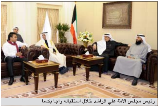
رئيس مجلس الأمة علي الراشد خلال استقباله راجا بكسا

استقبل رئيس مجلس الأمة علي الراشد في مكتبه ظهر أمس عضو البرلمان السيلاني وابن رئيس الجمهورية نامل راجا بكسا والوفد المرافق له. جرى خلال المقابلة تقديم التهانئ بوفور على الراشد برئاسة مجلس الأمة وبحث سبل التعاون بين البلدين الصديقين، لاسيما البرلمانية منها. حضر المقابلة أمين السر كامل العوضي وأمين عام مجلس الأمة علام علي الكندري ورئيس اتحاد كرة القدم السيلاني فرناندو ماني لال وعضو اللجنة الأولمبية محسن جيلاني، وكل من مانيل فرناندو ومالك فرناندو ومدير عام المجلس الأولمبي الآسيوي حسين علي المسلم ومدير شؤون المقر ومدير الشؤون الإدارية سامي العبطان الشمري. من جانب آخر بعث الراشد ببرقيات تهنئة إلى كل من رئيس مجلس النواب في جمهورية كازاخستان نورلان نعماتولين ورئيس مجلس الشيوخ خيرات مامي، ورئيس مجلس النواب في مملكة البحرين خليفة بن أحمد الظهري، ورئيس مجلس الشورى علي بن صالح الصالح ورئيس المجلس الوطني سيلويون تشوغد في مملكة بوتسوانا نامجي بنجور ورئيس الجمعية الوطنية تشوغو جيجم تشولتيم ورئيس مجلس الشورى في قطر محمد بن مبارك الخليفي ورئيس الجمعية الوطنية في جمهورية النيجر هاما امارو، وذلك بمناسبة الأعياد الوطنية لبلادهم. كما بعث رئيس مجلس الأمة