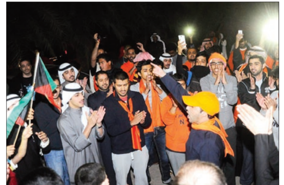
جانب من التجمع الشبابي