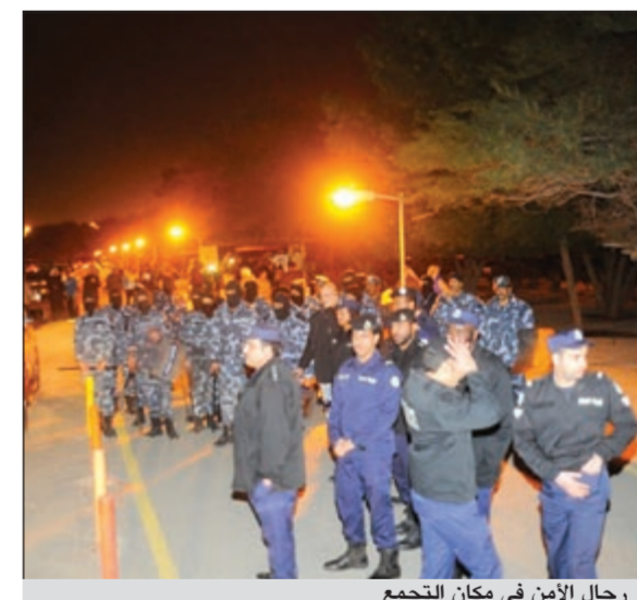
رجال الأمن في مكان التجمع