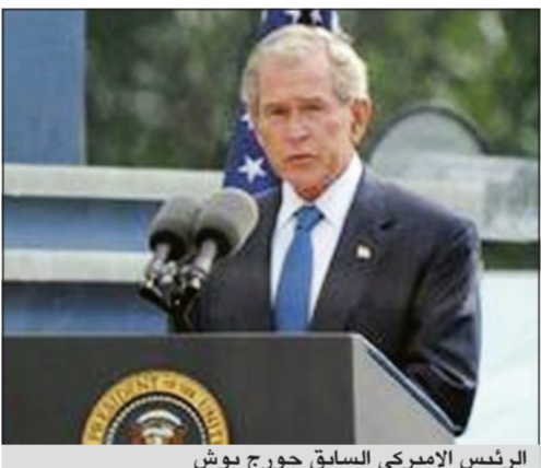
الرئيس الأميركي السابق جورج بوش

تكساس - سي ان ان: تعرض شاحنة صغيرة يملكها الرئيس الأميركي السابق جورج بوش في مزاد علني الشهر المقبل لصالح مؤسسة «فيشر هاوس» التي توفر السكن المجاني لأعضاء أسر الجنود والمجنّدين الذين يتلقون الرعاية الطبية بعيداً عن المنزل. وكان الرئيس الأميركي السابق اشترى الشاحنة البيضاء من طراز «فورد»، بعد انتهاء فترة ولايته في ذات العام.