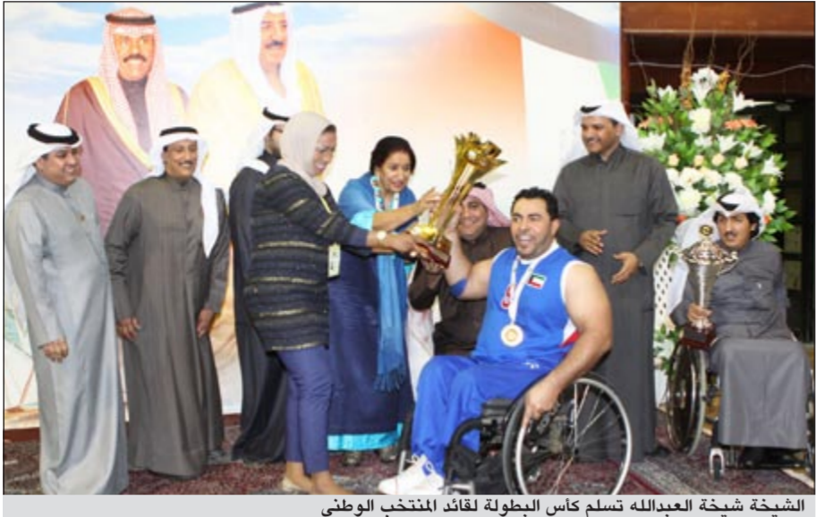
الشيخة شيخة العبدالله تسلم كأس البطولة لقائد المنتخب الوطني

المنتخبات الفائزة بالبطولة وتوزيع الميداليات للاعبين وكذلك تكريم رؤساء الوفود المشاركة بالبطولة. وعبر رئيس اللجنة المنظمة للبطولة شافي الهاجري في تصريح له «كونا» عن سعادته بتحقيق المنتخب الوطني البطولة ومحافظةهم على لقبها للمرة السادسة على التوالي.