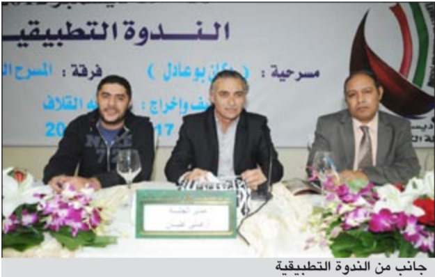
جانب من الندوة التطبيقية

وكان زعيمة عقب على العرض متسائلا اذا كان المخرج بين اللغة العربية واللهاجة المحلية موفقا؟ وهل الارتجال كان مناسبة، مشيرا الى ان الثيمة الدرامية ليست جديدة وسبق ان تم تناولها دراميا، وقال: هناك محاولة وسعي من المؤلف المخرج باضافات على النص الاصلي حتى يكون أكثر حرية،