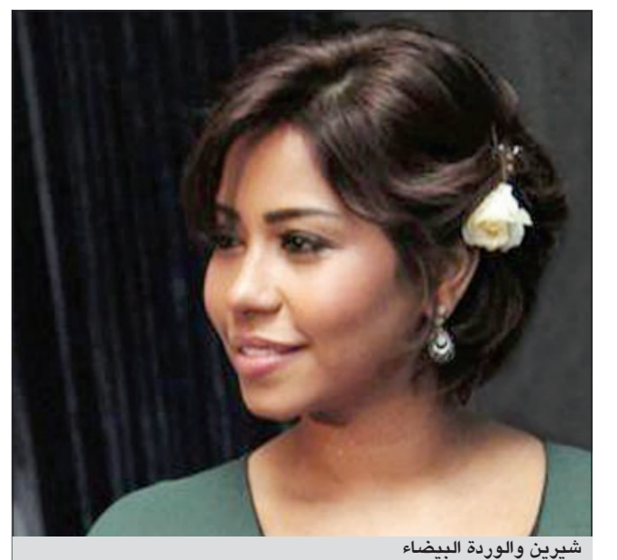
شيرين والوردة البيضاء

للمرة الثانية، فاجأ المطرب العراقي كاظم الساهر الفنانة المصرية شيرين عبدالوهاب وأهداها وردة خلال الحلقة الأخيرة الماضية من برنامج The Voice على الهواء. وسعدت شيرين كثيرا بوردة قيصر الغناء العربي البيضاء، وطلت محتفظة بها وتشمها طوال فترة الاستراحة، ولكن ذلك لم يمنعها