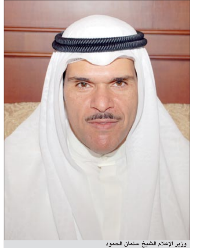
وزير الإعلام الشيخ سلمان الحمود

لفرقة المسرح الكويتي «نرفانا» لفرقة مسرح الخليج العربي «دكان بوعادل» لفرقة المسرح العربي. ويضمن حفل الختام الليلة تكريم أعضاء لجنة التحكيم والفرق المشاركة في المهرجان، كما سيتم عرض فيلم تسجيلي عن الاعمال المشاركة والمؤتمرات الصحافية والندوات التطبيقية التي صاحبت هذه الدورة. من