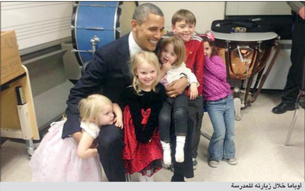
أوباما خلال زيارته للمدرسة

نيوتاون - يو.بي.أي: التقى الرئيس الأميركي براك أوباما أهالي ضحايا مجزرة المدرسة الابتدائية في كونيتيكت وتقدم لهم بالتعازي كما تعهد في كلمة ألقاها خلال حفل تأبين أقيم في نيوتاون بالعمل على تفادي المزيد من المآسي، مشددا على ضرورة التغيير.