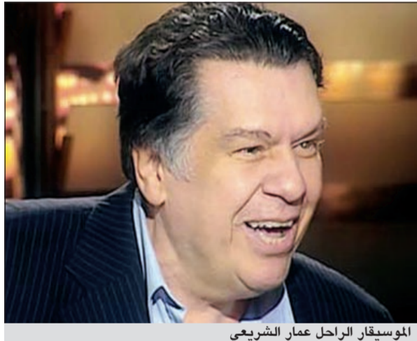
الموسيقار الراحل عمار الشريعي

قررت نقابة الموسيقين المصرية منح الموسيقار الراحل عمار الشريعي لقب نقيب الموسيقين واستخراج بطاقة شرف تثبت رئاسته لنقابة الموسيقين. وقال عضو مجلس النقابة الفنان مصطفى كامل، بحسب موقع «النشرة»: هذا أقل ما يمكن أن تقدمه ويكفي أن الراحل لم يأخذ علاجه من الدولة كما أنه لم يأخذ حقه لناحية التغطية الإعلامية لجنازته أو عزائه، فكان يجب على الفضائيات أن تقوم بإحياء سهرات خاصة لعمار الشريعي تسرد من خلالها تاريخه وأعماله الموسيقية.