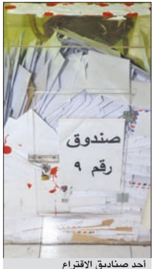
أحد صناديق الاقتراع

وقال المصدر «إن الرياض تأتي حالياً في صدارة