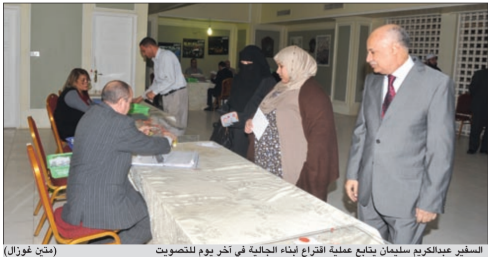
السفير عبدالكريم سليمان يتابع عملية اقتراع أبناء الجالية في آخر يوم للتصويت (متين غوزال)

وزارة الخارجية والمكاتب الفنية التابعة للسفارة واصلوا العمل ليل نهار لإنجاز هذه المهمة الوطنية على أكمل وجه وبشفافية ونزاهة وحياد. وأشاد السفير المصري في هذا الإطار بجهود الدبلوماسيين وموظفي السفارة والفريق المعاون من وزارة الخارجية والجهود الكبيرة التي بذلتها السلطات الكويتية في تامين عملية الاستفتاء.