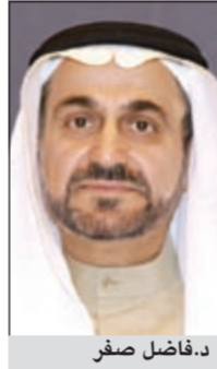
د. فاضل صفر

يستضيف الإعلامي عمار تقي اليوم الثلاثاء على قناة الكوت الفضائية في الساعة 10 مساءً الوزير السابق د. فاضل صفر في برنامج «لقاء خاص» يتناول فيه الأحداث الأخيرة على الساحة السياسية.