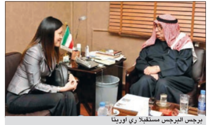
برجس البرجس مستقبلاً ري أوريتا

أشادت القائم بالأعمال بالسفارة الفلبينية لسدى البلاد ري أوريتا بجهود جمعية الهلال الأحمر في مساعدة الشعب الفلبيني جراء الكوارث الطبيعية التي تتعرض لها بلادها. وأعربت أوريتا عقب لقائها