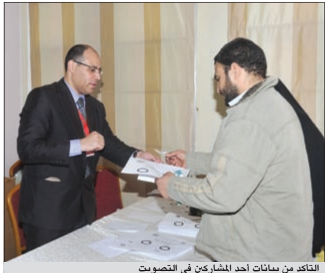
التأكد من بيانات أحد المشاركين في التصويت