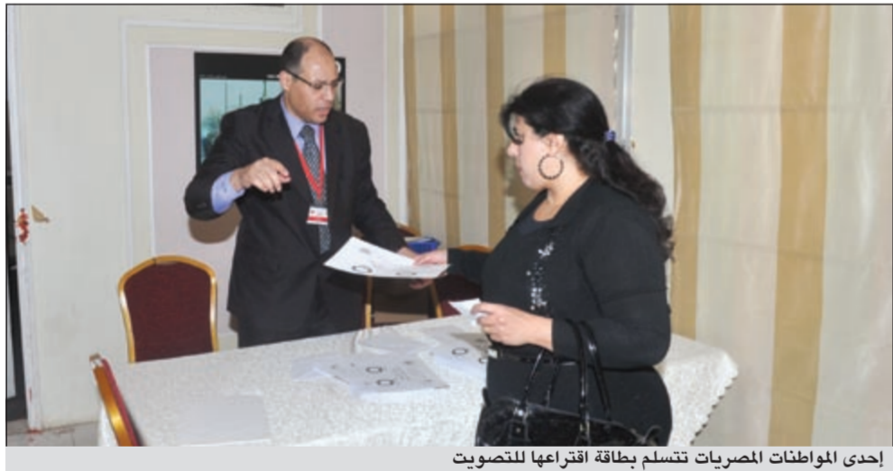
إحدى المواطنات المصريات تتسلم بطاقة اقتراعها للتصويت

وتوقع السفير المصري عبد الكريم سليمان في تصريحات لـ «الأخبار» أن تنتهي السفارة من عملية فرز أصوات المشاركين الذين يقارب عددهم 50 ألفاً خلال اليوم الثلاثاء أو غد الأربعاء على أن تعلن النتيجة فور الانتهاء من عملية الفرز وجمع النتائج. ولفى إلى أن طاقم السفارة والفريق المعاون من