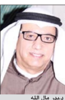
د.دبير مال الله

برعاية وزير الدولة لشؤون التخطيط والتنمية ووزير الدولة لشؤون مجلس الأمة ورئيس مجلس أمناء المعهد العربي للتخطيط د.رولا دشني ينظم المعهد العربي للتخطيط بالتعاون مع إدارة التنمية والسياسات الاجتماعية بالأمانة الفنية لمجلس وزراء الشؤون الاجتماعية العرب، المنتدى الإقليمي حول «اقتصاديات الربيع العربي» والبحر الميت في المملكة الأردنية الهاشمية والذي تفتتح أولى جلساته اليوم وعلى مدار يومين (17 و 18 الجاري) بحضور خبراء اقتصاديين يمثلون العديد من الدول العربية ووزراء حاليين وسابقين، بالإضافة إلى مجموعة من الباحثين الدوليين المتخصصة.