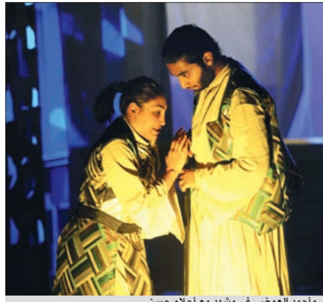
..وأحمد الغزالي في مشهد مع أحلام حسن

تعرض الفنان أحمد السقا بداية هذا الأسبوع لحادث سير، مما تسبب في إصابته في أنفه تتطلب إجراء عملية جراحية في الأنف. السقا خضع بالفعل لتدخل جراحي من خلال د. ماجد بهجت بمستشفى مصر الدولي، وذلك حسب جريدة عين. وقد طمأن السقا جمهوره على حالته الصحية، وأكد أنه بصحة جيدة. يذكر أن الفنان أحمد السقا كان قد اعتاد على انتقاد الأوضاع السياسية التي تمر بها مصر من خلال أشعار