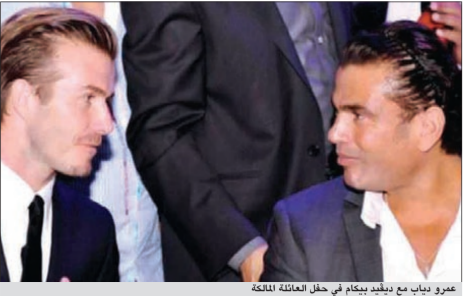
عمرو دياب مع ديفيد بيكام في حفل العائلة المالكة

العالمين، أبرزهم لاعب كرة القدم الإنجليزي «ديفيد بيكام» الذي جلس إلى جانب عمرو دياب، حيث تتبادلا الحديث إلى جانب لاعبة التنس العالمية «سيرينا وليامز»، والكاتبة «حسن شحاتة»، المدير الفني السابق لمنتخب مصر.