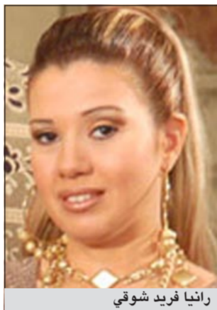
رائيا فريد شوقي