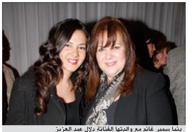
دنيا سمير غانم مع والدتها الفنانة دلال عبد العزيز

أرغمت الفنانة دنيا سمير غانم، والدتها الفنانة دلال عبدالعزيز، على رفض العديد