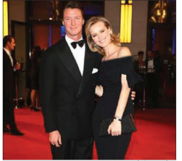
إيفا هيرزيغوفا وزوجها

لوس أنجليس - يوبي. أي: تنتظر المعارضة التشيكية إيفا هيرزيغوفا طفلاً ثالثاً من زوجها غريغوريو مارساج. وأكدت وكالة ستورم موبل عرض الأزياء لصحيفة دايلى تلغراف البريطانية أن المعارضة الشهيرة البالغة من العمر 39 سنة حامل للمرة الثالثة، مشيرة إلى أن الطفل سيولد خلال فصل الربيع المقبل. يشار إلى أن لهيرزيغوفا وزوجها ولدين هما فيليب (21 شهراً) وجورج (5 سنوات) ويذكر أن هيرزيغوفا مشهورة في عالم الزياء وهي معروفة بشكل خاص بفضل اعلانات ونديبر مع العلم أنها الوجه الجديد لمنتجات العناية بالوجه.