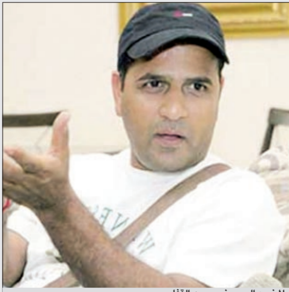
المخرج البحريني محمد القفاص