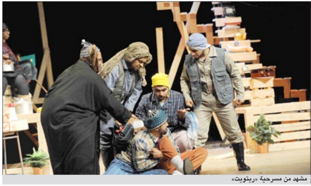
مشهد من مسرحية «ريوتيت»

الجامعي كانت متعطرة قبل سنوات في عدة دورات مهرجانية واتسمت عروضها بالضعف والسطحية لدرجة جعلتها أقرب الى العروض المدرسية، إلا أنها نجحت في