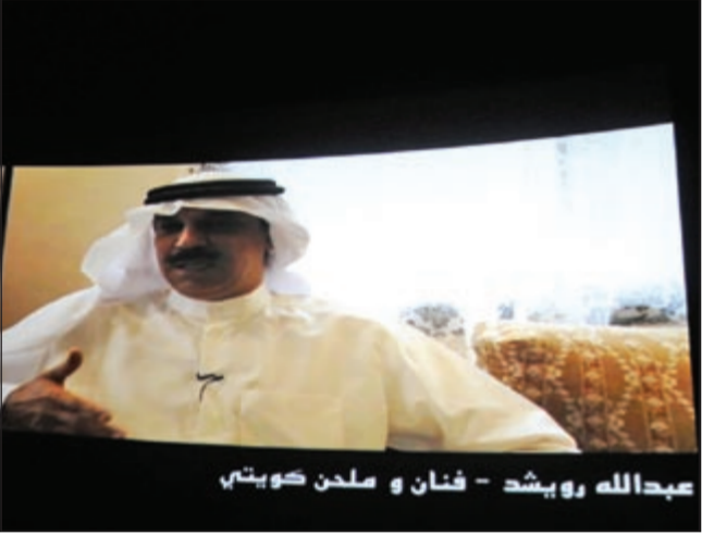
عبدالله رويشد - فنان و ملحن كويتي