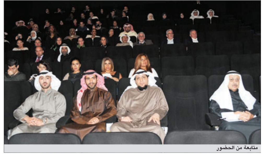
متابعة من الحضور