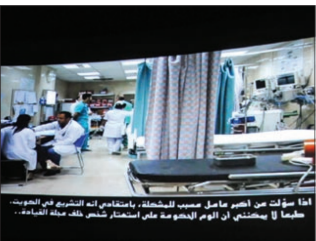
أما سؤلات من أصغر عامل صيني للشحمة، باعتباره أنه التزم في الكويت، فطبعاً لا يهتني أن اليوم الحكومة على استعداد شخص خلف حملة القيادة...