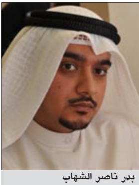
بدر ناصر الشهاب

وتابع: «إننا نمر بمرحلة دقيقة من مراحل العمل الوطني بمواجهة التحديات الداخلية والخارجية ونرجو من الحكومة تنفيذ توصيات صاحب السمو الأمير الدائمة والخاصة بمسيرة الإصلاح والتنمية تحقيقاً لتطلعات الشعب والعمل لاجل الوطن والمواطن في إطار التطبيق الحازم للقوانين وحتى تعود الكويت إلى مكانتها المتقدمة بين سائر الدول وتكون سباقاً كما عهدناها في السابق في شتى المجالات».