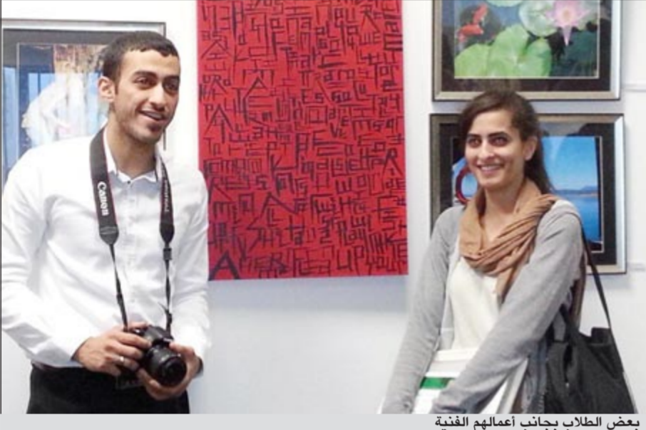
بعض الطلاب بجانب أعمالهم الفنية

من زوار الجامعة. يعتبر «معرض رئيس الجامعة» فرصة جيدة للطلاب حيث ينمي اعزازهم بانجازاتهم، ويكافئ المتميزين من أعمالهم، وينقل خبراتهم، مما يضيف قيمة لسيرهم الذاتية عند تخرجهم والتحاقهم بالدراسات العليا او بمجالات العمل المختلفة.