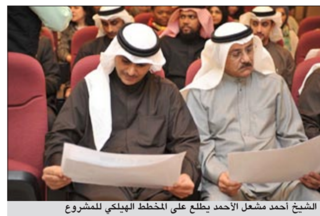
الشيخ احمد مشعل الأحمد يطلع على المخطط الهيكلي للمشروع

وأضافت: أبرزنا للوفد اهم المعوقات التي تواجه المشروع، مشددة على ان تلك الزيارة ستصب في مصلحة المشروع من خلال تبني جهاز متابعة الأداء الحكومي لتلك المعوقات ومحاولة إيجاد الحلول الجزئية لها بما يساهم في دفع عجلة سير المشروع.