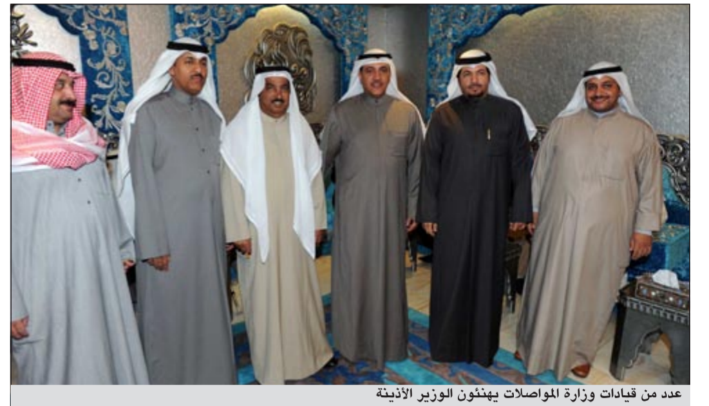
عدد من قيادات وزارة المواصلات يهنئون الوزير الأذينة