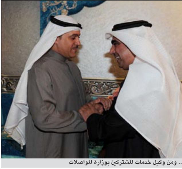
.. ومن وكيل خدمات المشتركين بوزارة المواصلات

استهل وزير الكهرباء والماء ووزير الأشغال العامة م.عبدالعزیز الإبراهيم مهام عمله في اول يوم لتوليته حقيبة وزارة الأشغال باجتماع موسع ضم الوكلاء المساعدين بالوزارة، حيث أبدى الوزير الإبراهيم عدة ملاحظات حول القطاعات المختلفة. وقالت مصادر مطلعة ان الوزير طلب من الوكلاء المساعدين وضع آليات للمشكلات التي تعاني منها القطاعات التابعة لهم ورافق هذه المشكلات مع الحلول المقترحة في تقارير معتمدة على ان يبيد ملاحظاته حول هذه التقارير وتكون ملزمة فيما يتعلق بالتنفيذ. وشدد الوزير م.الإبراهيم في اجتماعه الذي امتد قرابة الساعتين على تجاوز