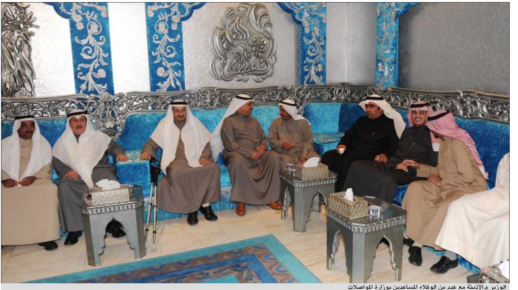
الوزير م.الأذينة مع عدد من الوكلاء المساعدين بوزارة المواصلات