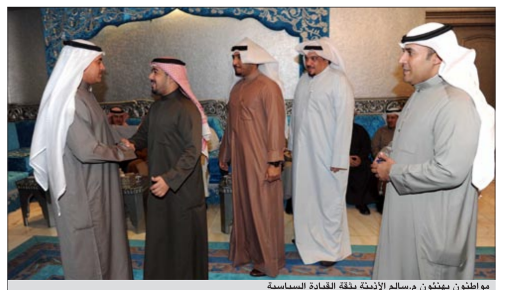
مواطنون يهنئون م.سالم الأذينة بثقة القيادة السياسية