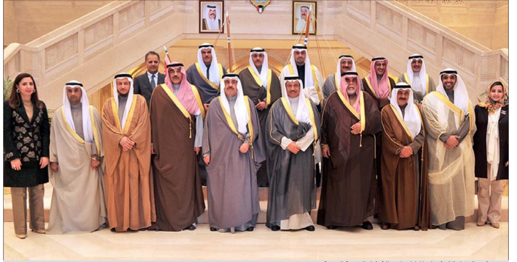
سمو رئيس الوزراء الشيخ جابر المبارك متوسطا أعضاء الحكومة الجديدة

وقال د.الهيبي انه سيعمل على قدم وساق لانجاز وحل الملفات