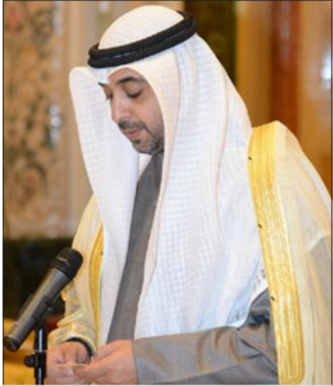
الشيخ محمد عبدالله خلال أداء اليمين