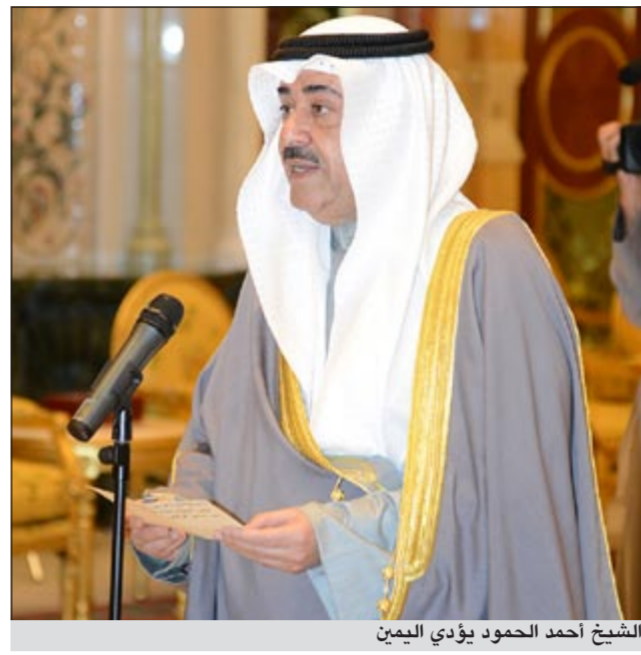
الشيخ أحمد الحمود يؤدي اليمين