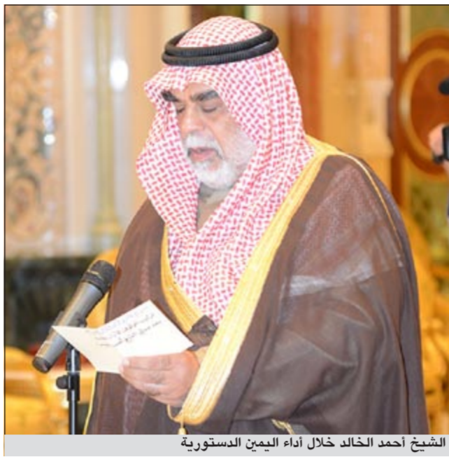
الشيخ أحمد الخالد خلال أداء اليمين الدستورية