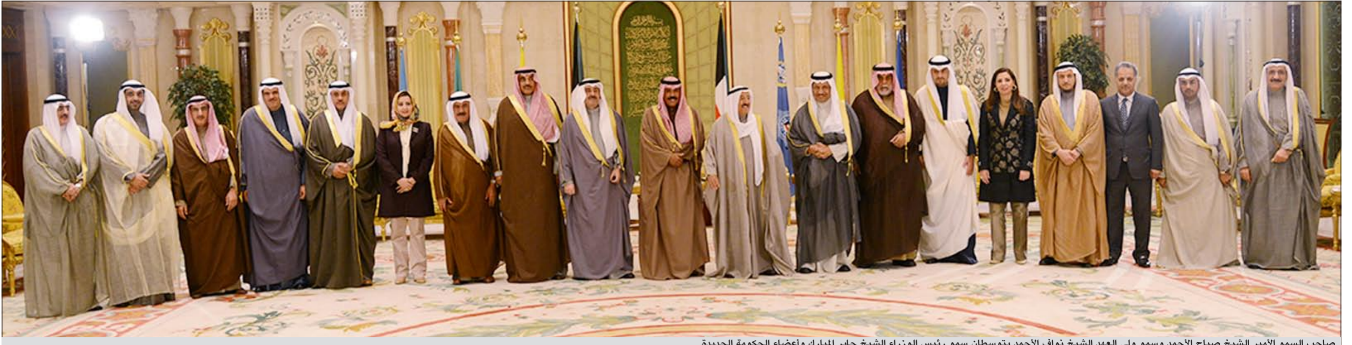
صاحب السمو الأمير صباح الأحمد وسمو ولي العهد الشيخ نواف الأحمد يتوسطان سمو رئيس الوزراء الشيخ جابر المبارك وأعضاء الحكومة الجديدة

صاحب السمو تشهد أداء اليمين الدستورية للحكومة