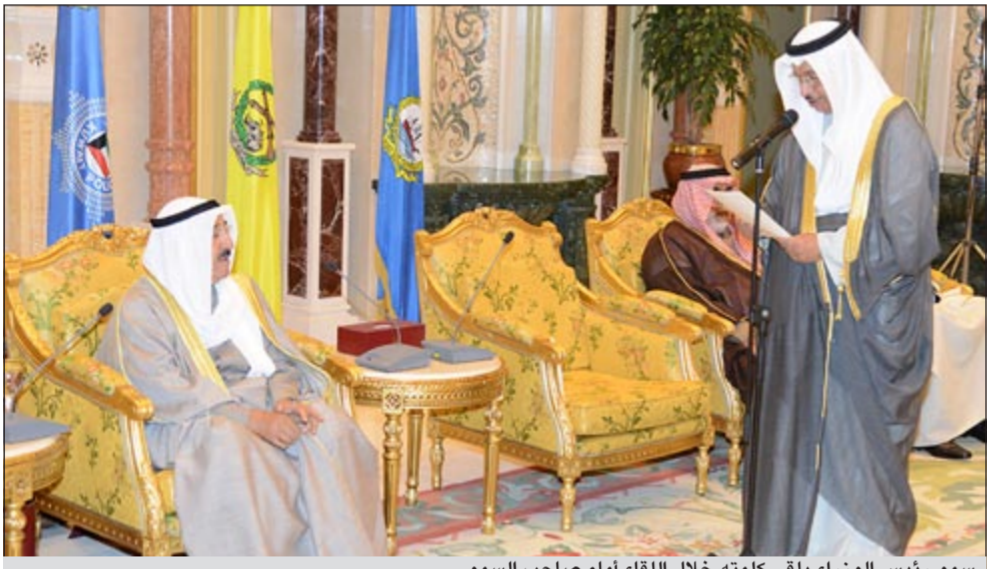
سمو رئيس الوزراء يلقي كلمته خلال اللقاء أمام صاحب السمو