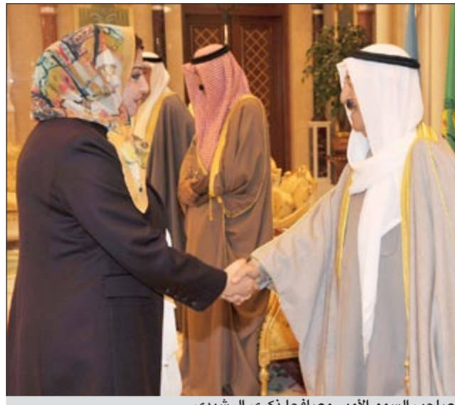
صاحب السمو الأمير مصافحا ذكرى الرشيد