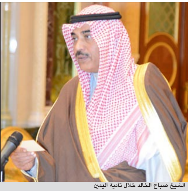
الشيخ صباح الخالد خلال تادية اليمين