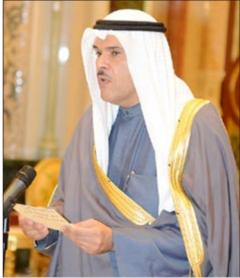
الشيخ سلمان الحمود خلال أداء اليمين الدستورية