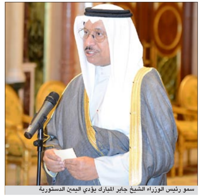
سمو رئيس الوزراء الشيخ جابر المبارك يؤدي اليمين الدستورية

صاحب السمو: نتطلع إلى تعاون إيجابي وبناء ومثمر بين السلطين لتحقيق تطورات المواطنين