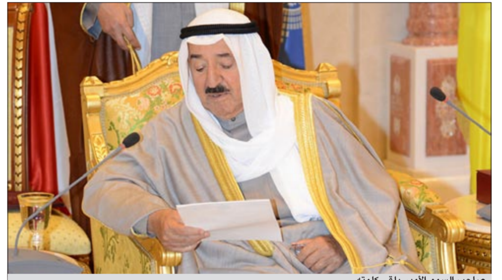
صاحب السمو الأمير يلقي كلمته

جديدة نحو تنفيذ كافة المشاريع التنموية المهمة التي تم إقرارها والتي ستبني طموحات المواطنين. انني لعلني ثقة تامة بانكم أهل لتولي مسؤولياتكم وانكم قادرون بحسب الله تعالى على تجاوز كل العقبات بتعاونكم وتآزركم وإصراركم على مواصلة مسيرة الإصلاح والتنمية. اسأل المولى تعالى ان يعينكم ويسدد خطاكم لكل ما فيه خير ورفعة وطننا العزيز وان يحفظ وطننا الغالي من كل سوء ويديم عليه نعمة الأمن والأمان والرخاء وان يجعلنا جميعا من الشاكرين لنعمة الجليلة التي آفاه بها علينا وان يعيننا على تأدية حقوقنا بالحمد والشأن. والقى سمو رئيس مجلس