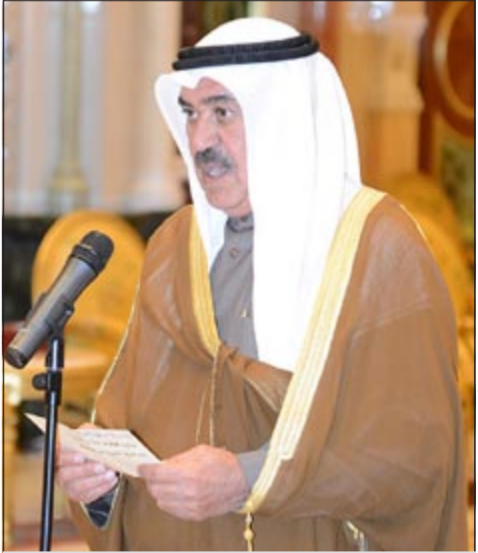
مصطفى الشمالي يؤدي اليمين الدستورية