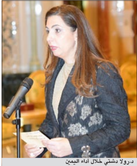
د. رولا دشتي خلال أداء اليمين