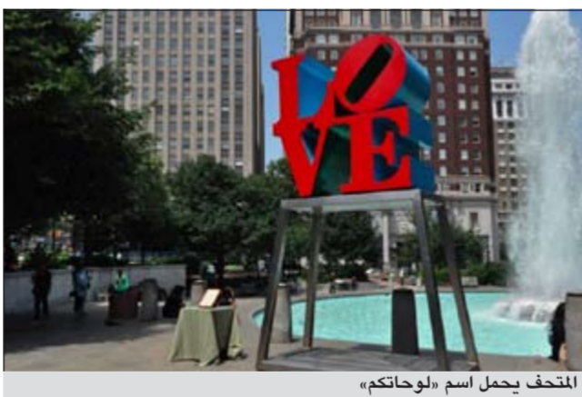
المتحف يحمل اسم «لوحاتكم»