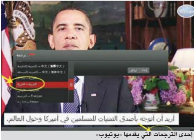
إحدى الترجمات التي يقدمها «يوتيوب»

وإذا كانت المادة في اليوتيوب ليس لها ملصق ترجمة خاص توفر، التقنية الجديدة وهي الترجمة الصوتية هذا النص لتقوم بترجمته لاحقا إلى اللغة المطلوبة.