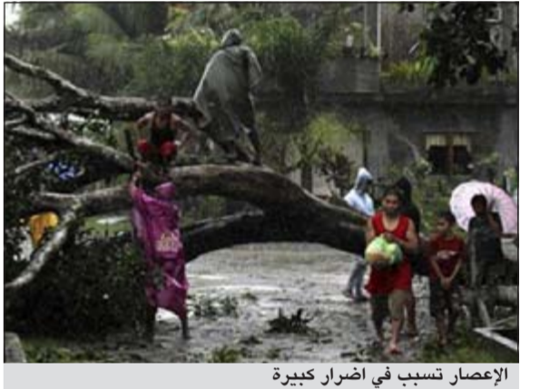
الإعصار تسبب في اضرار كبيرة

كوالالمبور - كونا: أعلنت الفلبين امس ان حصيلة أقوى إعصار تشهده الفلبين هذا العام (بونا) تجاوزت الـ 700 قتيل فيما لايزال المئات في عداد المفقودين حتى اليوم معظمهم من الصيادين الذين يخشى فقدانهم في البحر.