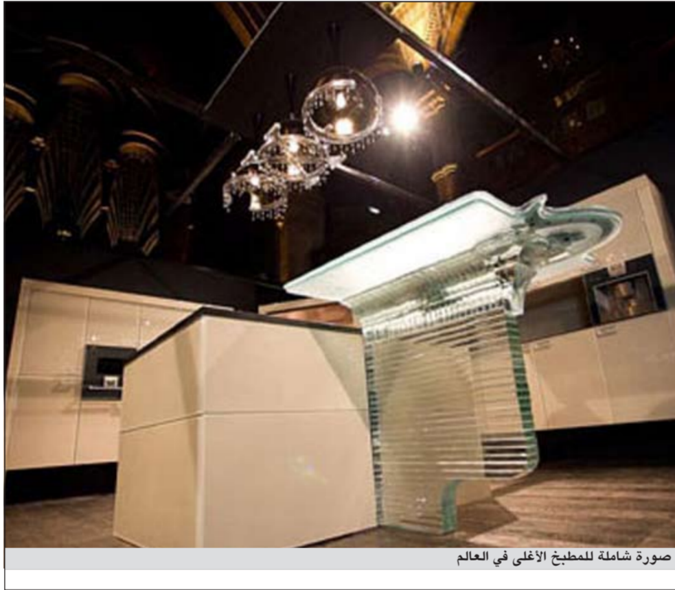
صورة شاملة للمطبخ الأعلى في العالم