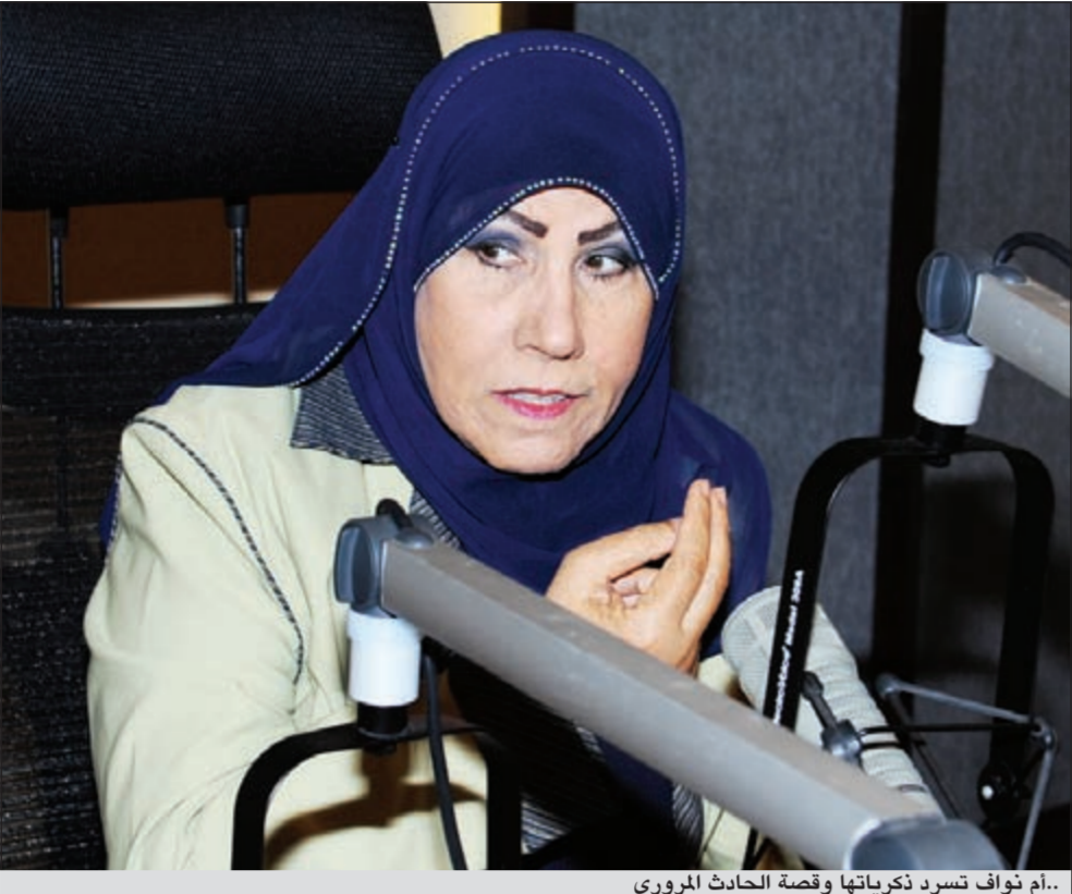
أم نواف تسرد ذكرياتها وقصة الحادث المروري