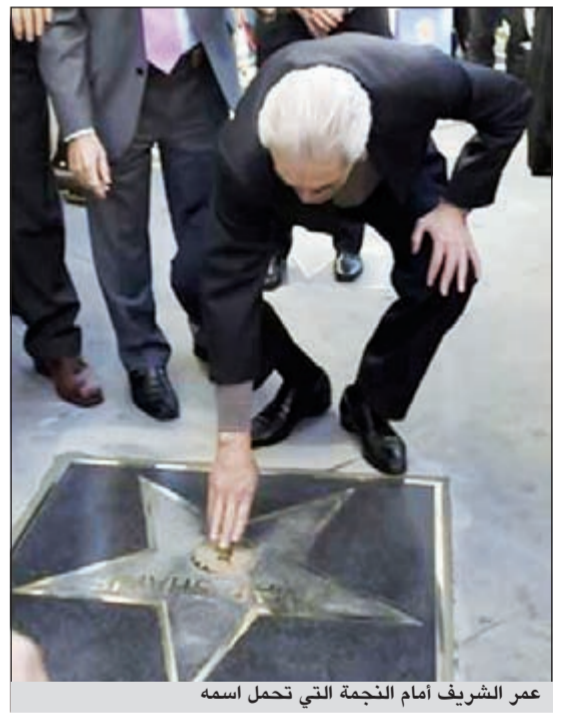
عمر الشريف أمام النجمة التي تحمل اسمه

هذا وعبر عن فرحته الكبيرة بالعودة إلى الميريا، مؤكداً أنها كانت نقطة البداية في مسيرته الفنية وأنه ولولا فيلم «لورانس العرب»، لما كان اليوم هو «عمر الشريف».