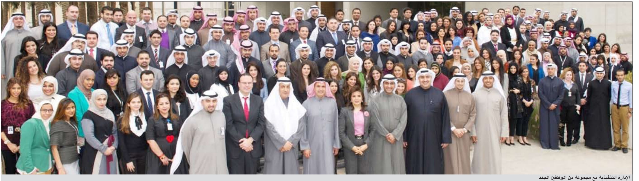
الإدارة التنفيذية مع مجموعة من الموظفين الجدد