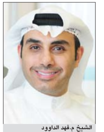
الشيخ م.فهد الداوود

وبين الداوود ان تنامي الطلب العالمي للنفط خلال العام المقبل ودعم استمرار الطلب في الاسواق الواعدة في بلدان آسيا، بالإضافة الى تقلص حجم انكماش الطلب في البلدان الصناعية وزيادة العروض من امدادات النفط الخام من خارج الاوبك تعدد من الاساسيات والمستجدات التي يجب ان ينظر اليها بعين الاعتبار خلال الاجتماع لاتخاذ اي من القرارات. وقال ان ما يحدث في السوق العالمي من تداعيات وأهمها المشكلات المالية في بلدان أوروبا والتعافي الاقتصادي البطيء في الولايات المتحدة وازدياد حدة مشكلة البطالة في بعض بلدان العالم تعد مخاوف يضعها المتخصصون كركائز