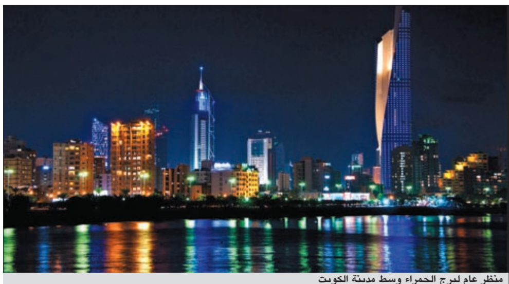
منظر عام لبرج الحمراء وسط مدينة الكويت