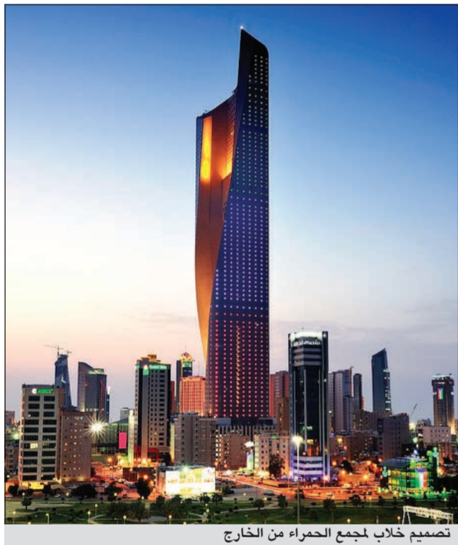
تصميم خلاب لجمع الحمراء من الخارج