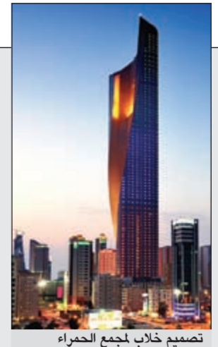
سمو الأمير يفتتح اليوم برج الحمراء في احتفال يليق بهذا الصرح العالمي 30 تصميم خلاب لجمع الحمراء