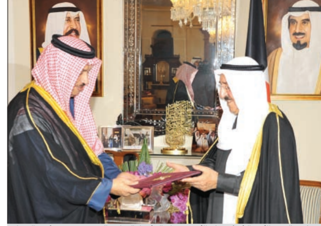
صاحب سمو الأمير الشيخ صباح الأحمد يتسلم التشكيلة الوزارية الجديدة من سمو رئيس الوزراء

وتطلعات أهل الكويت جميعاً. واذ يشرفني يا حضرة صاحب السمو أن أرفع لمقامكم السامي أسماء زملاء من الأخوة والأخوات الذين قبلوا مشكورين معاويتي في المهمة الثقيلة التي عهدتموها سموكم البنا وفق مسؤولية المنصب الوزاري المرشح له كل منهم. فإن حاز هذا الترشيح قبولاً لدى سموكم تفضلتم بإصدار المرسوم اللازم لتشكيل الوزارة. واذ أتطلع مخلصاً يا صاحب السمو مع زملائي الوزراء لخدمة وطننا الغالي فإننا نعاهد الله العظيم ثم سموكم بأن نضع أنفسنا وخيرأتنا لحشد كل الطاقات والإمكانات لتحقيق انجاز محسوس وملحوس في مسيرة البناء والتنمية وتنفيذ آمال وتطلعات أبناء هذا الوطن المعطاء وما تأملون سموكم من هذه الوزارة تحقيقه لرفعة الكويت العالية وخير أبنائها. أدعو الله أن يوفقنا جميعاً ويمدنا بعونه لتحقيق العمل الناجح المأمول تحت قيادة سموكم الرشيدة وتوجيهاتكم الحكيمة لتحقيق الأمان والآمال وطموحات المواطنين.