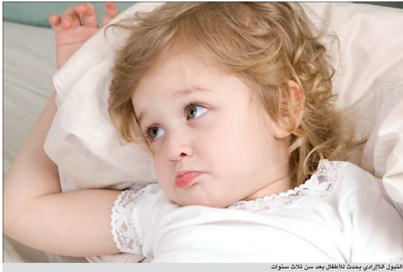
التبول اللاإرادي يحدث للأطفال بعد سن ثلاث سنوات