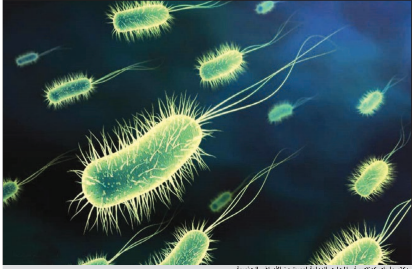
بكتيريا «إي كولاي» في المجاري البولية ليست من الأمراض الجنسية

كان التهاب يأخذ المريض مضادا حيويا وإذا كان ضيقا تجري له توسعا وإذا كان السبب صمام، يتم علاجه.