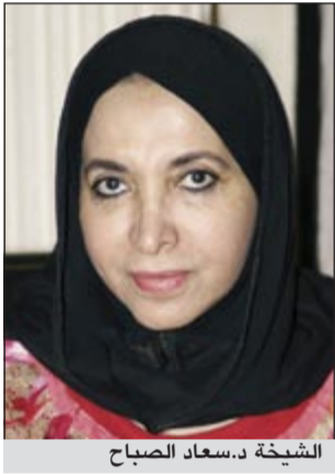
الشبيخة د.سعاد الصباح