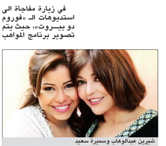
شيرين عبد الوهاب وسميرة سعيد

في زيارة مفاجأة إلى استديوهات الـ «فوروم دو بيسروت»، حيث يتم تصوير برنامج المواهب «صوت الحياة»، التقت الفنانة شيرين عبد الوهاب لجنة تحكيم البرنامج، في كواليس البرنامج، فكان اللقاء بحسب موقع النشرة مع الفنانة سميرة سعيد والموسيقار حلمي بكر والفنان هاني شاكر. يذكر أن شيرين عبد الوهاب هي عضو لجنة تحكيم برنامج «نا فويس» إلى جانب الفنان عاصي الحلاني والفنان صابر الرباعي والفنان كاظم الساهر.