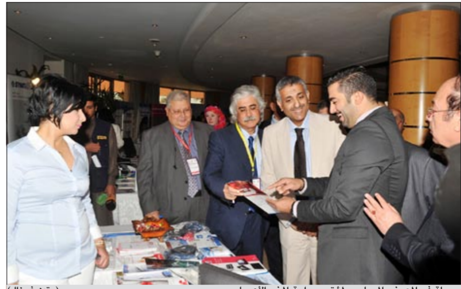
جولة في المعرض المصاحب لمؤتمر جراحة المخ والأعصاب