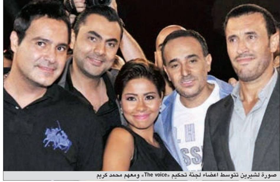
صورة لشيرين تتوسط أعضاء لجنة تحكيم «The voice» ومعهم محمد كريم

في حلقة نارية من برنامج المواهب «The Voice» الذي يعرض على قناتي «MBC» و«MBC مصر»، والذي يقدمه محمد كريم وأروى جودة، استمر المتسابقون في منافساتهم الشرسة في كل مجموعة من مجموعات عاصي الحلاني، شيرين عبد الوهاب، صابر الرباعي، وكاظم الساهر للوصول إلى اللقب.