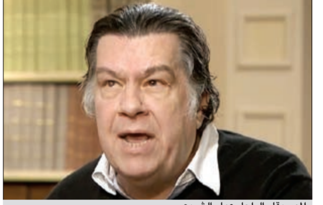
الموسيقار الراحل عمار الشريعي