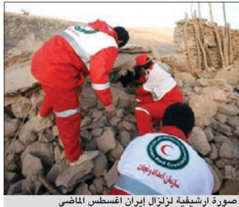
صورة ارشيفية لزلزال إيران أغسطس الماضي

دبي - سي ان ان: ذكرت وسائل إعلام إيرانية رسمية، إن زلزالاً بقوة 5,6 درجات على مقياس ريختر، ضرب محافظة خراسان الجنوبية شرق إيران، ما أدى إلى مقتل 6 أشخاص وإصابة 31 آخرين على الأقل. وأفادت وكالة مهر للأخبار شعبة الرسمية، نقلا عن مسؤولين في إدارة شؤون الطوارئ بمحافظة خراسان قولهم بأن «الزلزال خلف أضرارا واسعة، وأن الكثير من القرى تعرضت مساكنها لدمار كامل أو أضرار جزئية». وأضاف المصدر ان «قوة الهزة قدرت بـ 5,6 على مقياس ريختر، أعقبتها 20 هزة ارتدادية أدت إلى حدوث خلل في خطوط التلفون والانترنت». ونقلت الوكالة عن مركز رصد الزلازل التابع للمؤسسة الجيوفيزيائية بجامعة طهران، قوله إن «الزلزال وقع في الساعة الثامنة و38 دقيقة مساء بالتوقيت المحلي وهز بالخصوص مدينة قائن في محافظة خراسان الجنوبية».