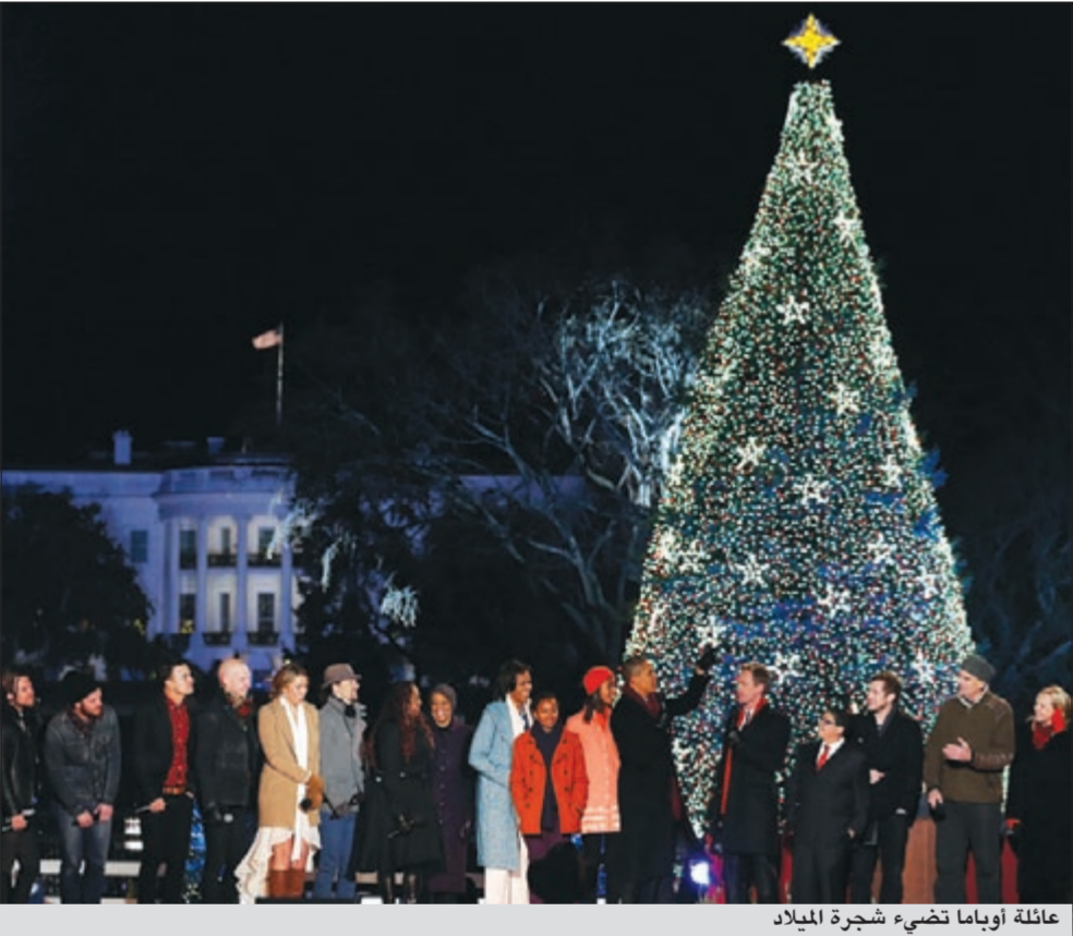
عائلة أوباما تضيء شجرة الميلاد

كما تضمن البرنامج أيضا قصة عن عيد الميلاد لتلتها السيدة الأولى ميشيل أوباما والممثل ريكو رودريجيز.