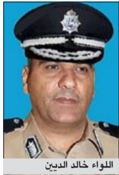
اللواء خالد الدين

أكد مدير عام الإدارة العامة للمؤسسات الإصلاحية اللواء خالد الدين أن التحضيرات لفعاليات أسبوع النزلي الخليجي الموحد لدول مجلس التعاون الخليجية تسير وفق البرنامج الموضوع لإنجازها تحقيقاً لأجرائها بما يليق بسمعة الكويت ورفع رصيدها لدى هيئات ومنظمات حقوق الإنسان ومن في حكمها، متمنياً بذلك موافقة وزراء داخلية مجلس التعاون الخليجي لاعتماد