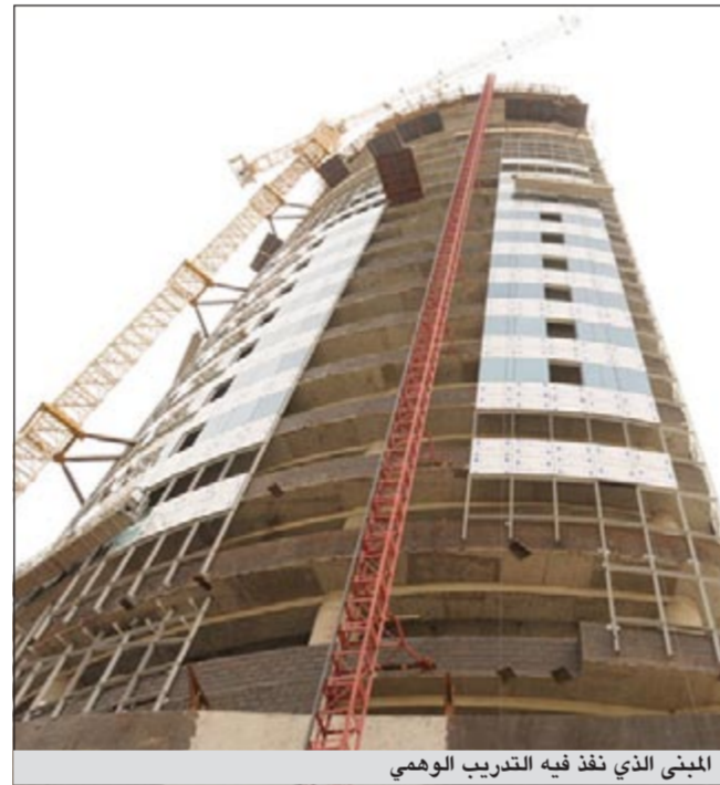
المبنى الذي نفذ فيه التدريب الوهمي