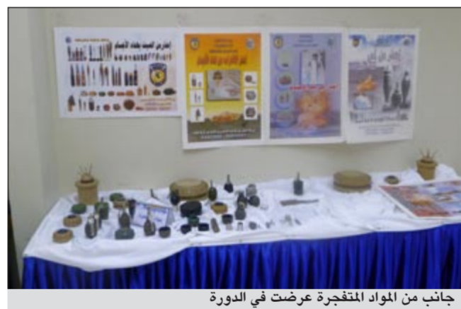
جانبا من المواد المتفجرة عرضت في الدورة