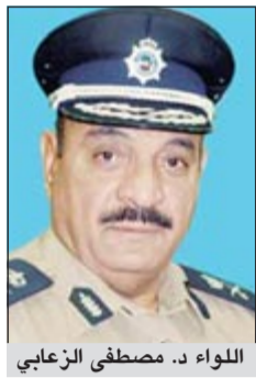
اللواء د. مصطفى الزعابي

في محاولة لتخفيف حدة الاختناقات على طريق الغزالي، وذلك في أعقاب إجراء تعديلات وتحسينات أعلن قطاع شؤون المرور بقيادة اللواء د. مصطفى الزعابي زيادة فترة حظر مرور الشاحنات القادمة والمغادرة من وإلى ميناء الشويخ والمنطقة الحرة لتصبح من الساعة السادسة والنصف صباحاً وحتى الساعة السابعة مساءً، عدا يومي الجمعة والسبت والعطلات الرسمية، وأوضح أن ذلك سيتم ابتداء من يوم الأحد المقبل الموافق 2012/12/9 بعد أن تم الاتفاق والتنسيق بين كل من مؤسسة الموانئ الكويتية والإدارة العامة للمرور ووزارة الأشغال العامة والإدارة العامة للجمارك وشركات المناولة العامة في ميناء الشويخ واتحاد الوكلاء الملاحية.