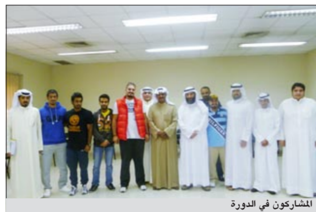
المشاركون في الدورة

أي مواد خطيرة وإن هناك تقاربا ونقفا وتبادلا للمعلومات حول طرق تهريب وإخفاء المواد الخطرة في حاويات كبيرة. وأشار إلى أن الإدارة العامة للجمارك تمتلك في التفتيش عدم تسرب أي مواد محظورة كان من الممكن أن تستغل لإثارة القلاقل وتهديد الأمن والاستقرار الكويتي. وتمن حرص قطاع الجمارك على توفير كل ما من شأنه حماية الأمن الداخلي، وذلك من خلال توفير الأجهزة والمعدات والتقنيات العالية، وكذلك تقديم الدورات لمفتشيها، وهذا ما حال دون دخول أي مواد محظورة.