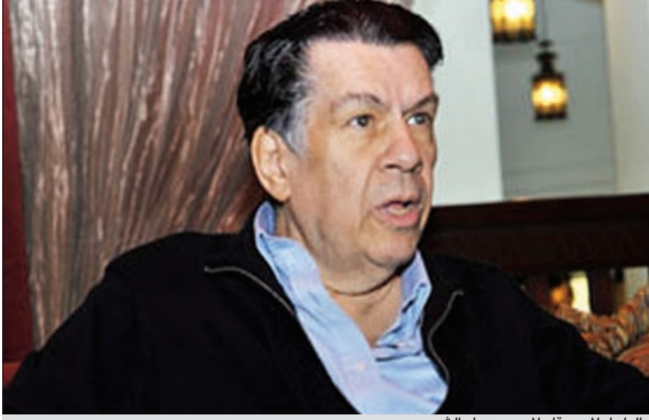
الراحل الموسيقار المصري عمار الشريعي

قد ادخل قبل أسبوعين تقريبا إلى العناية المركزة في أحد مستشفيات القاهرة، وأخضع للمتابعة الدقيقة والعلاج، وتبين للأطباء المشرفين أنه بحاجة إلى عملية زراعة قلب سريعة.