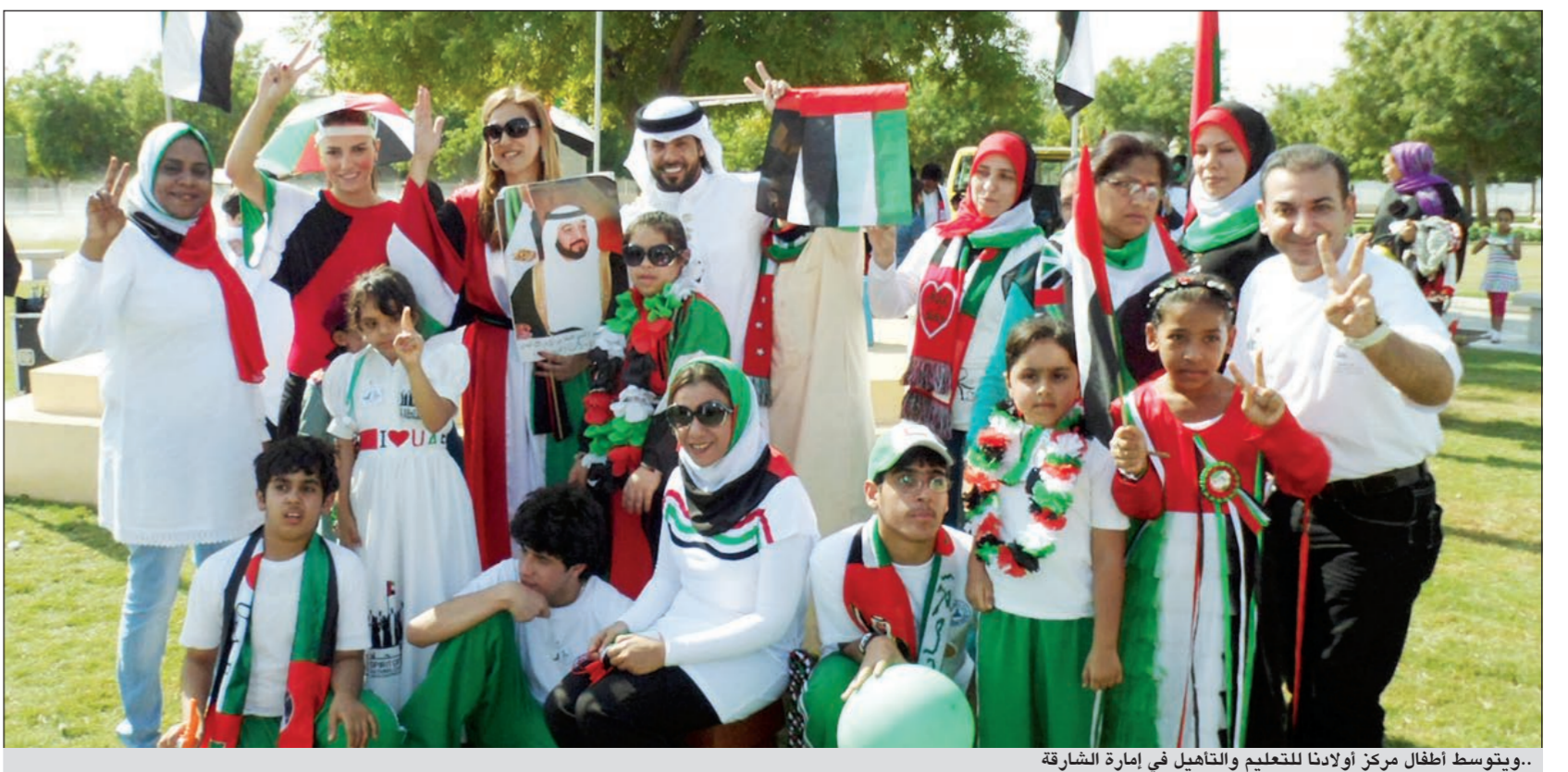
.. ويتوسط أطفال مركز أولادنا للتعليم والتاهيل في إمارة الشارقة

شارك الفنان الاماراتي عبد المنعم العامري، أطفال مركز أولادنا للتعليم والتاهيل في إمارة الشارقة بدولة الإمارات العربية المتحدة، ضمن احتفالية خاصة بمناسبة الاحتفالات باليوم الوطني الاماراتي الـ 41، وساهم بدعم الحملة الإنسانية التي يقوم بها المركز المخصص لرعاية ذوي الاحتياجات الخاصة، واحتفل معهم من خلال غناء مجموعة من أغنياته التي بدأها بالأغنية الوطنية التي أطلقها تحت عنوان «للوطن فرسان»، وشاركهم «اليولة» ضمن أجواء احتفالية تركت أثرا إيجابيا بين جميع الأطفال، وذكرى إنسانية خاصة لديه بشكل خاصة، وبالأطفال وعائلاتهم الذين أبدوا سعادة كبيرة بحضوره ومشاركتهم دعمهم في رعايتهم. وقد أبدى العامري الذي