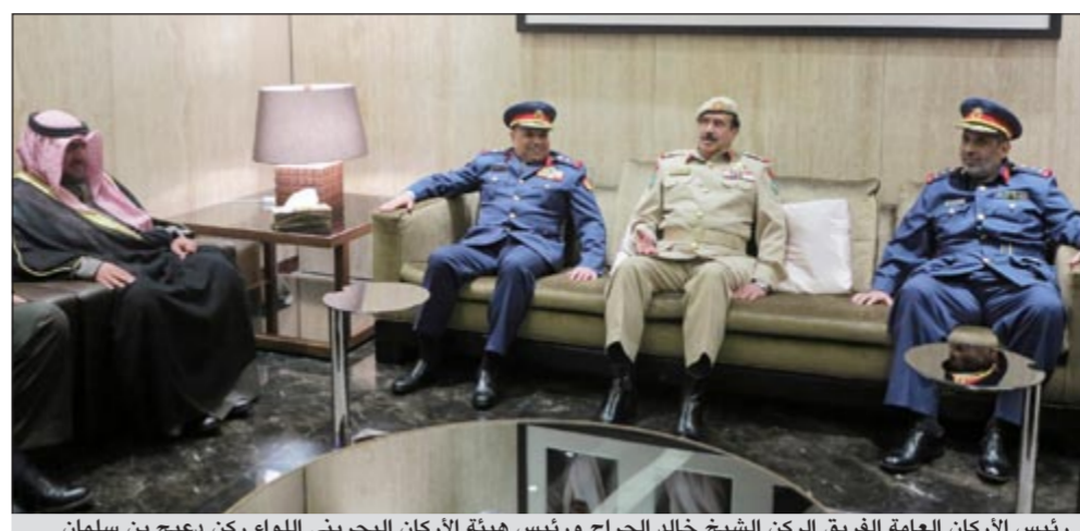
رئيس الأركان العامة الفريق الركن الشيخ خالد الجراح ورئيس هيئة الأركان البحريني اللواء ركن دعيج بن سلمان آل خليفة ونائب رئيس جهاز الأمن الوطني الشيخ ناصر العلي والمحلق العسكري العميد ركن علي العساكر

وستتناول المنتدى موضوع مكافحة الإرهاب والأمن في مضيق هرمز وتأثير السياسة الطائفية على أمن المنطقة والاستقرار في الشرق الأوسط إضافة الى ملف العلاقات مع الولايات المتحدة الأميركية.