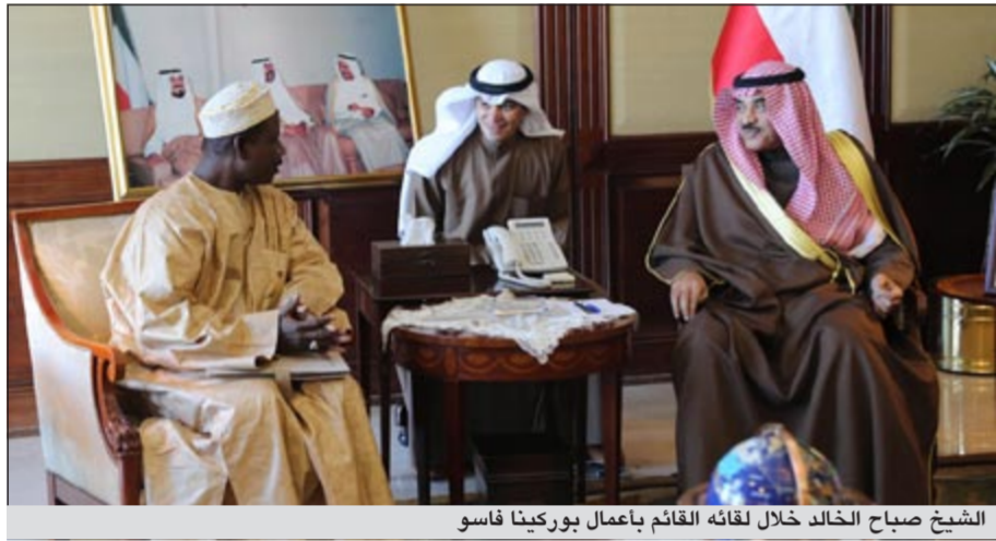
الشيخ صباح الخالد خلال لقائه القائم بأعمال بوركيننا فاسو

حضر مراسم الاحتفال وكيل وزارة الخارجية خالد الجارالله ومدير ادارة مكتب نائب رئيس مجلس الوزراء وزير الخارجية السفير الشيخ د.احمد ناصر المحمد ومدير ادارة المراسم السفير ضاري العجران ومدير ادارة افريقيا بالوكالة المستشار حمد المشعان.